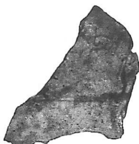
第204次調査出土文書②