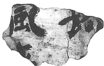
第204次調査出土文書①