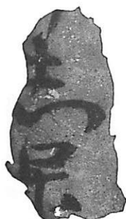
第245-1次調査 出土文書①