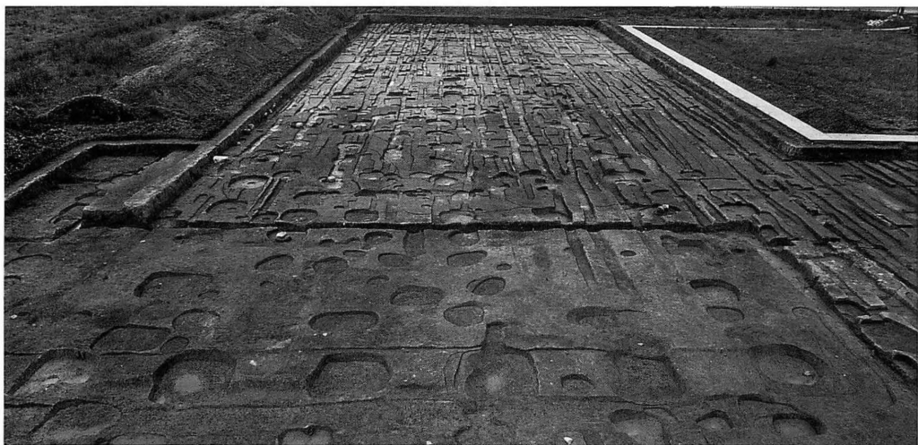
藤原宮第78次 東方官衙調査区（南から）