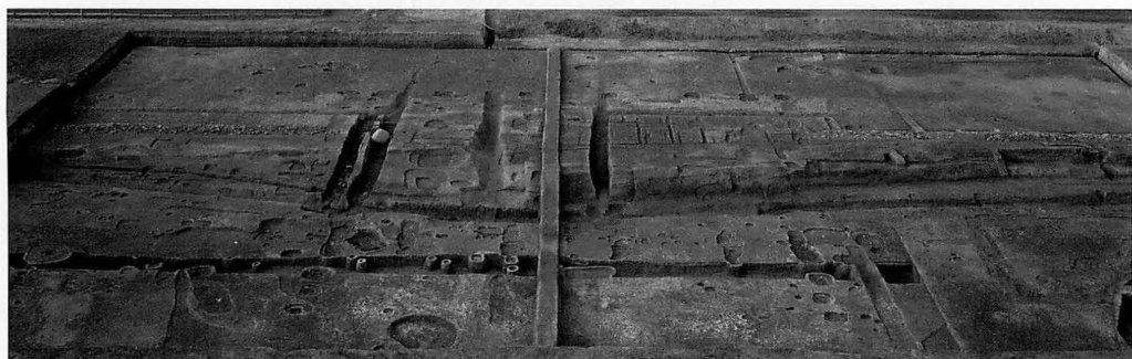
平城宮第265次 第二次朝堂院南門（南から）