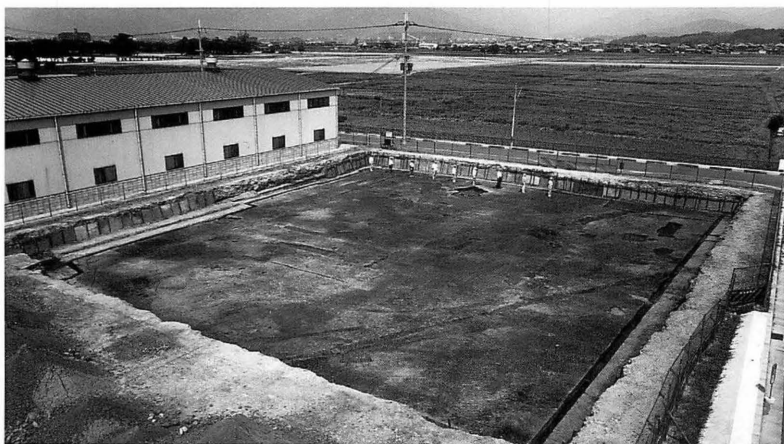
藤原宮第79次 西方官衙調査区（南西から）