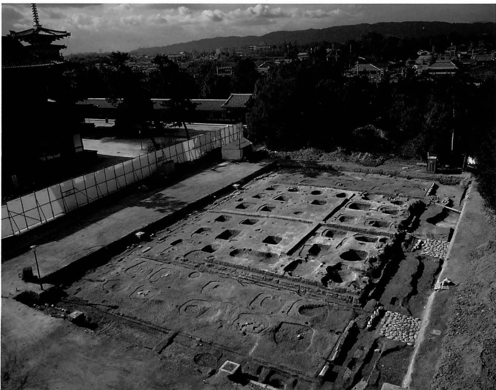
平城京 薬師寺講堂（北東から）