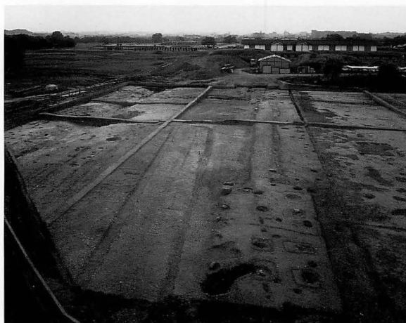
平城宮第259次 進酒司南門と宮内道路（東から）