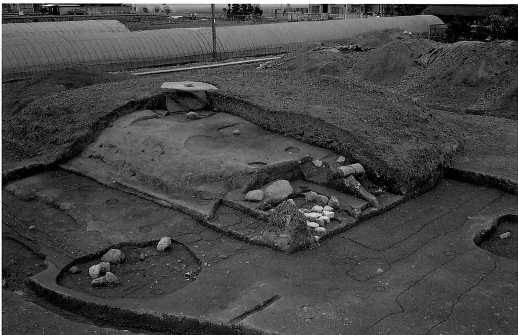
藤原京 本薬師寺西塔（南東から）