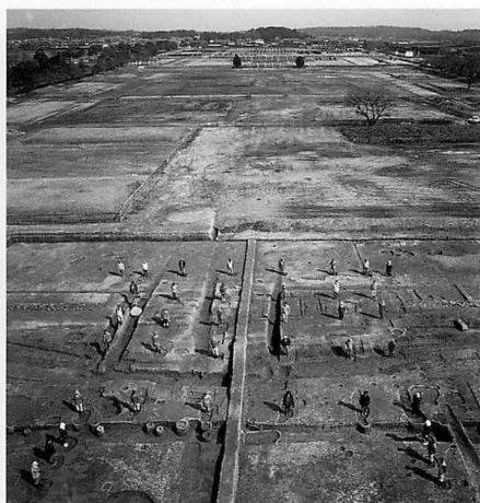
平城宮第265次 第二次朝堂院南門と柱列（南から）