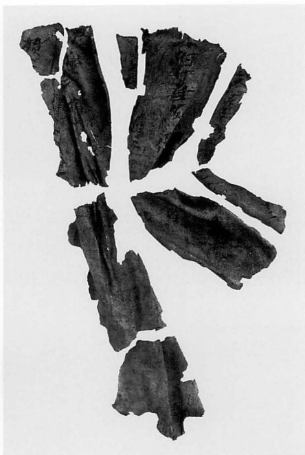
平城宮第259次調査出土 漆紙文書