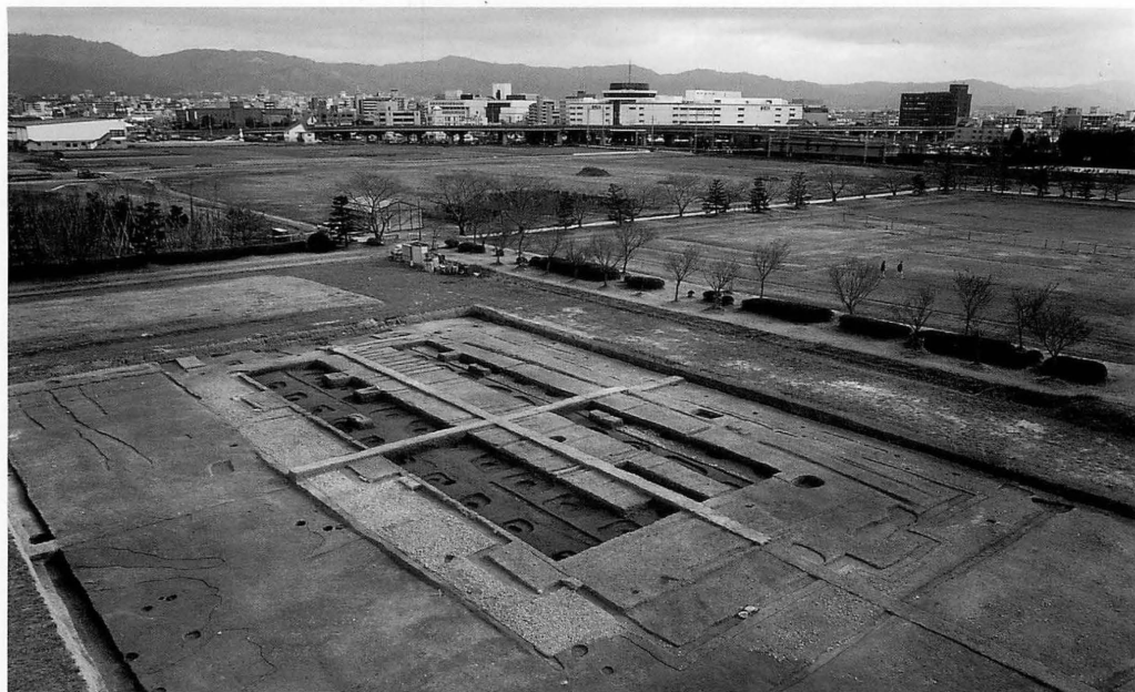
平城宮第261次 第二次朝堂院東第六堂（北西から）撮影 牛嶋 茂