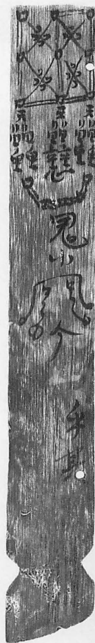
藤原宮第79次調査出土 呪符木簡