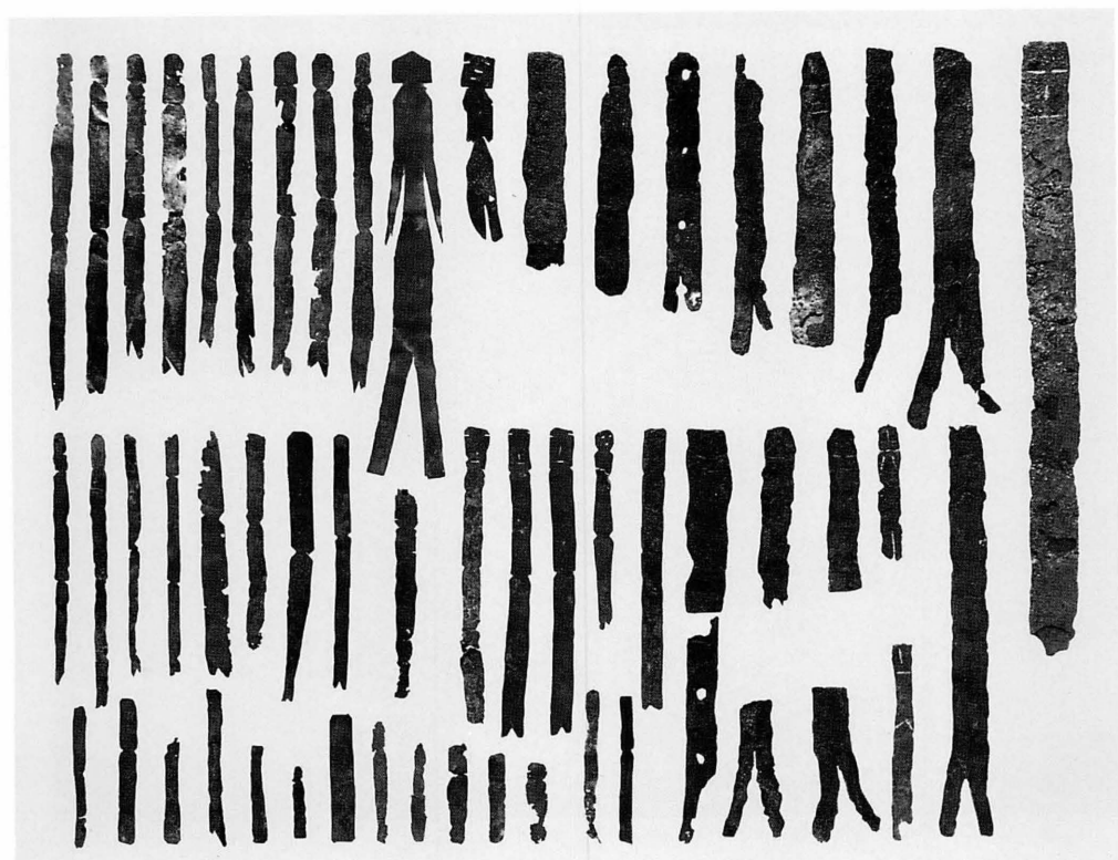
平城宮・京出土金属製人形