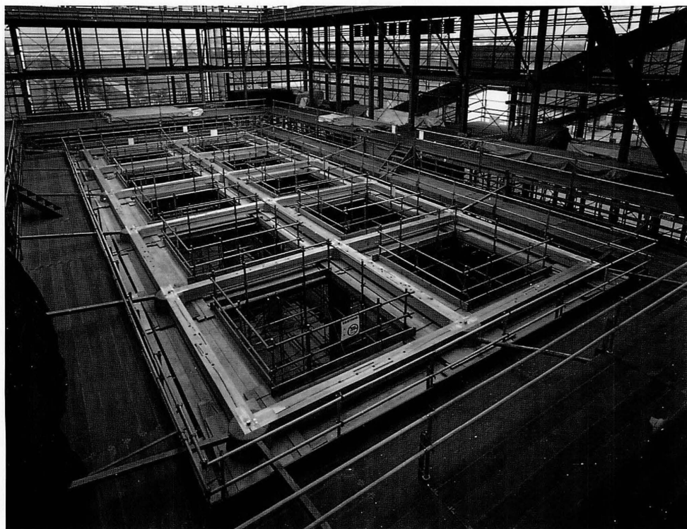
朱雀門復原工事 一重の柱を立て、その頂部に頭貫を組む