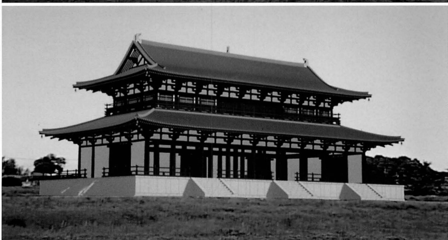
コンピューターグラフィックスによって復原される第一次大極殿