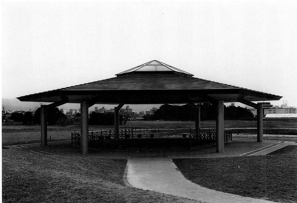
平城宮造酒司六角形井戸屋形覆屋