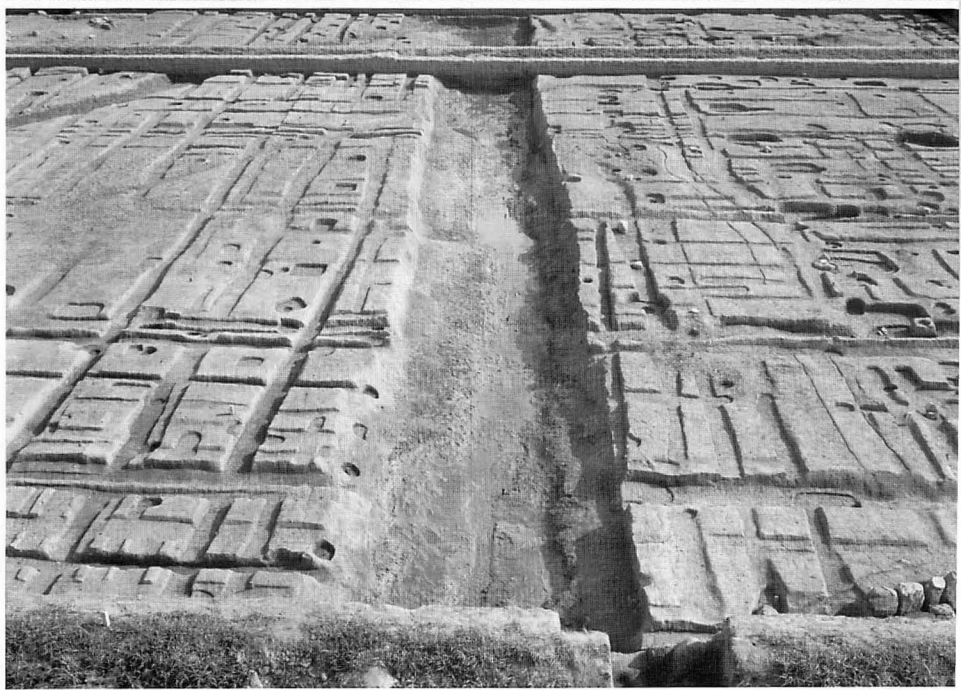
上 藤原宮第55次(東方官衙)調査区全景(北から) 下 藤原宮第55次(東方官衙)東大溝(北から)