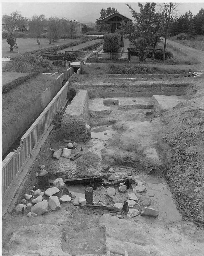
上 平城宮兵部省地区(南から) 下 平城宮南面大垣と大溝 SD 3715 交差点(東から)