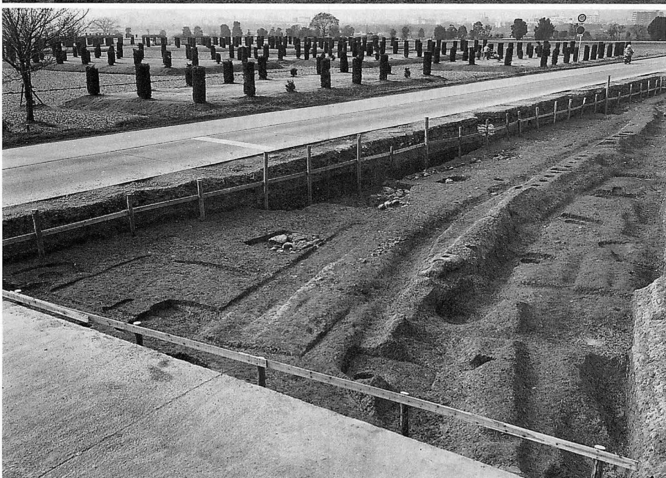
上 平城宮造酒司地区(南から) 下 平城宮内裏東北隅築地回廊(東北から)