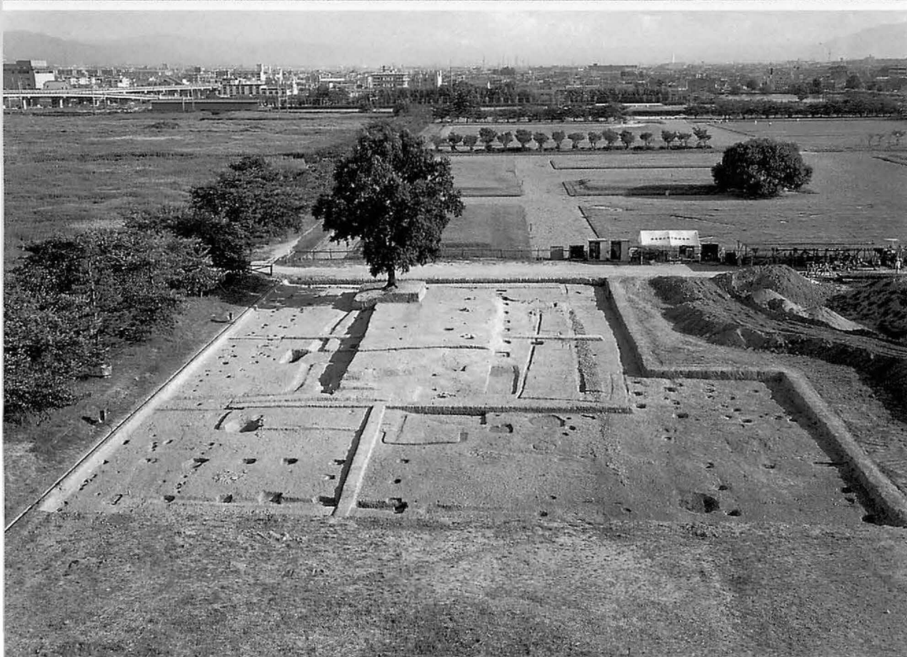
4 上 平城宮第一次朝堂院南門東側地区(東から) 下 同第二次朝堂院東第二堂(北から)