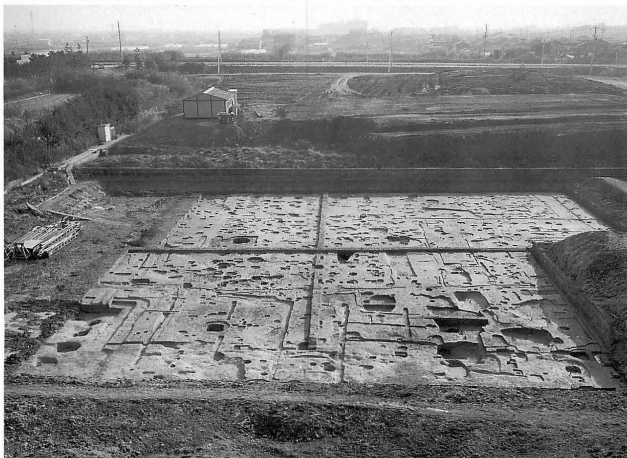
5 上 平城宮東大溝地区(南から) 下 平城京右京八条一坊十四坪(北から)