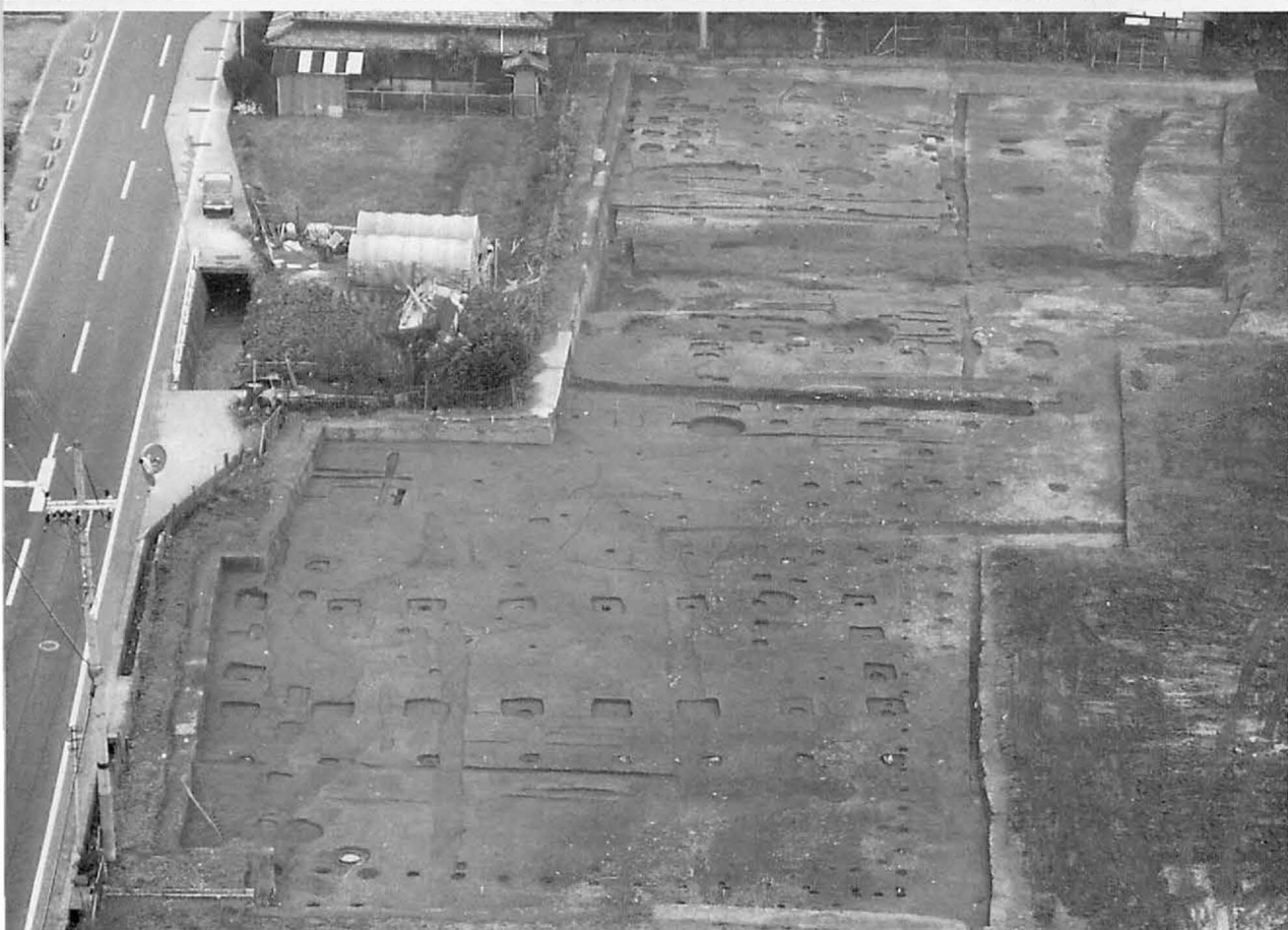
2 上 藤原宮第49次(右京七条一坊)調査区(北東から)