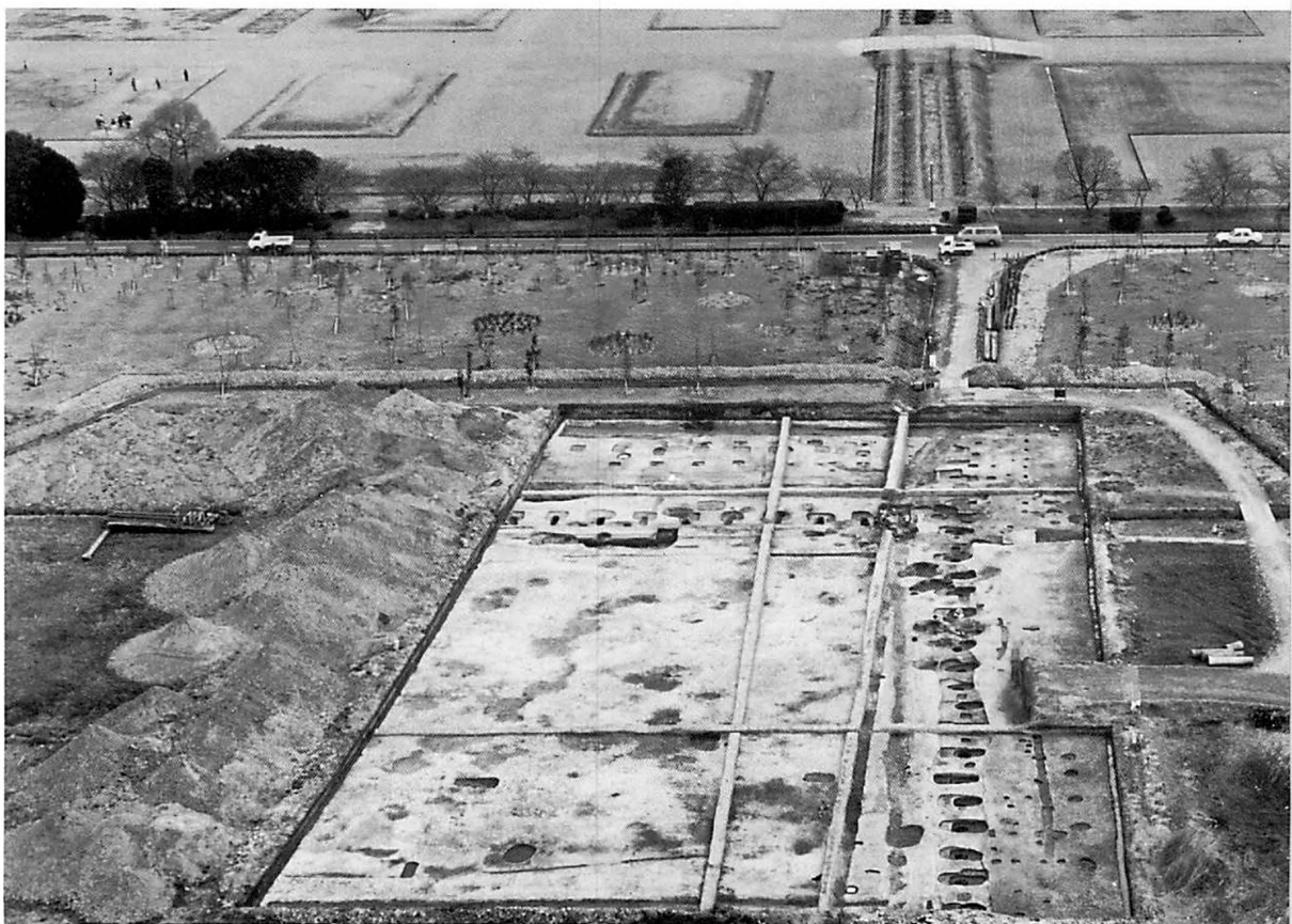
6. 平城宮大極殿後殿発掘遺構(北東から) 7. 平城宮第1次朝堂院東南隅発掘遺構(西から)