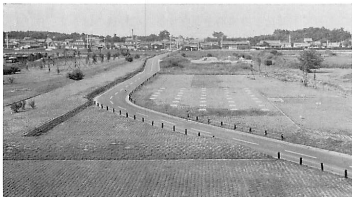
第2図 第2次内裏西外郭の整備