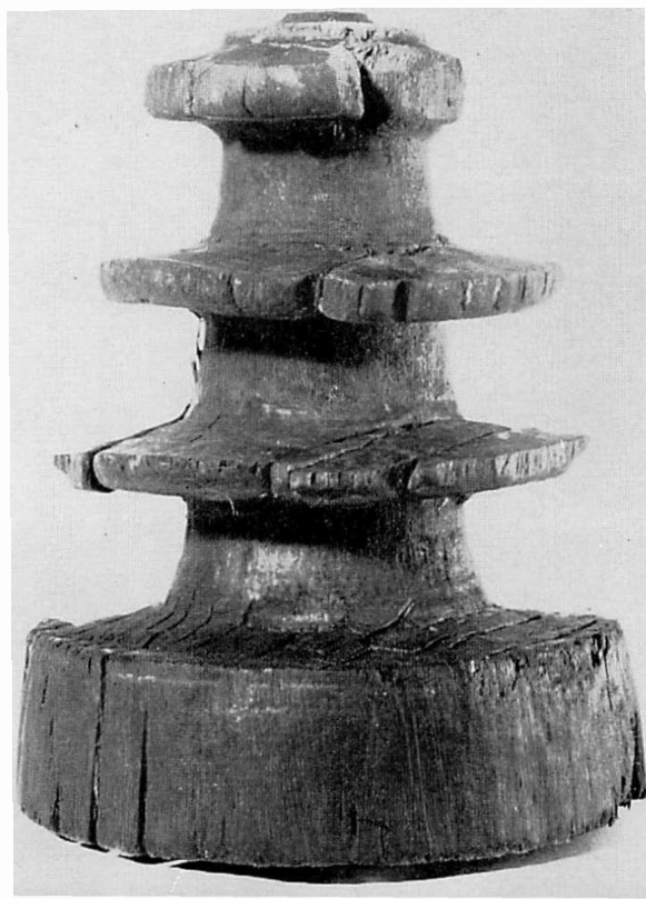
木製百万塔 平城宮跡