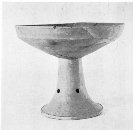
平城宮跡第14次調査出土弥生式土器