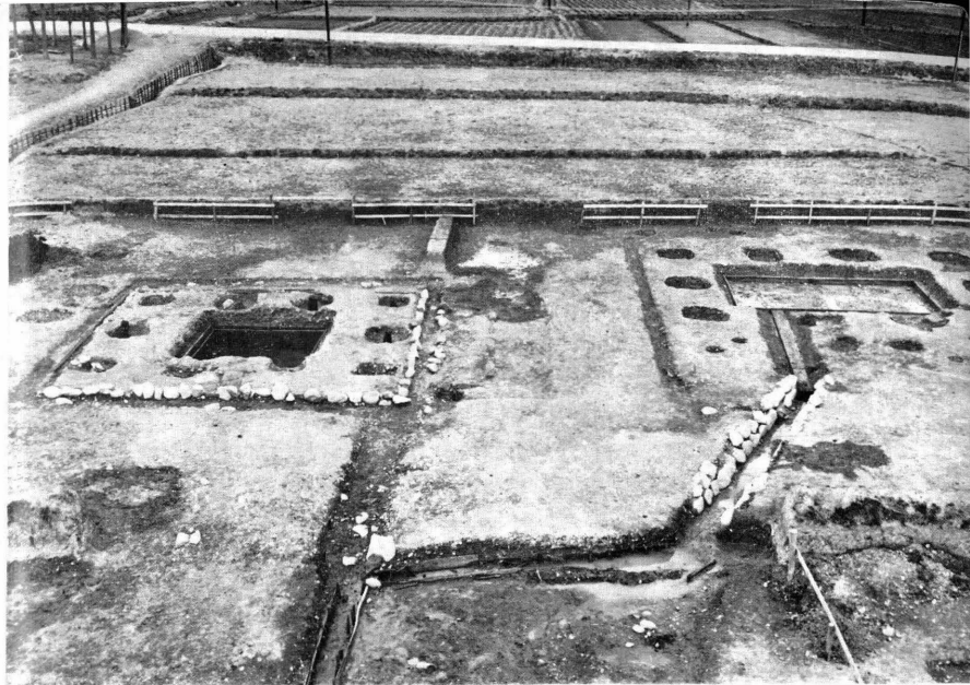
平城宮跡第22次調査北地区 井戸