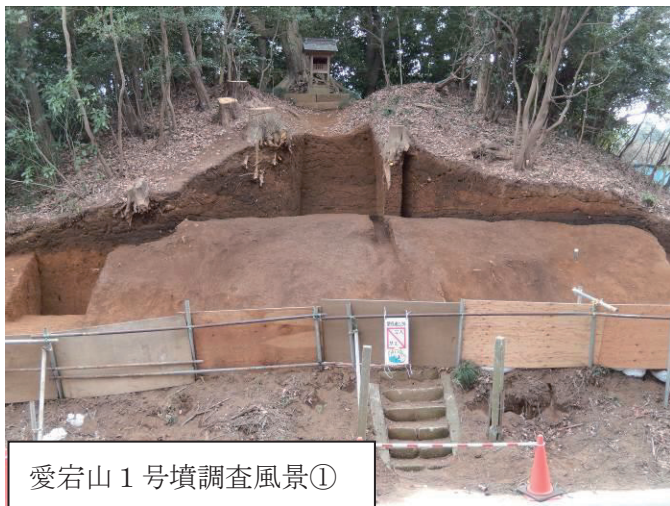
愛宕山 1 号墳調査風景①