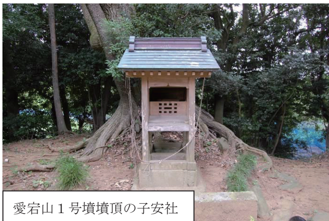
愛宕山 1 号墳墳頂の子安社