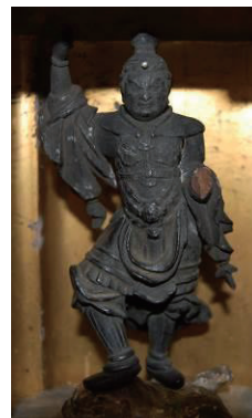
地福院の 金銅仏多聞天立像(下) 木造天部形立像(右) (県指定文化財)