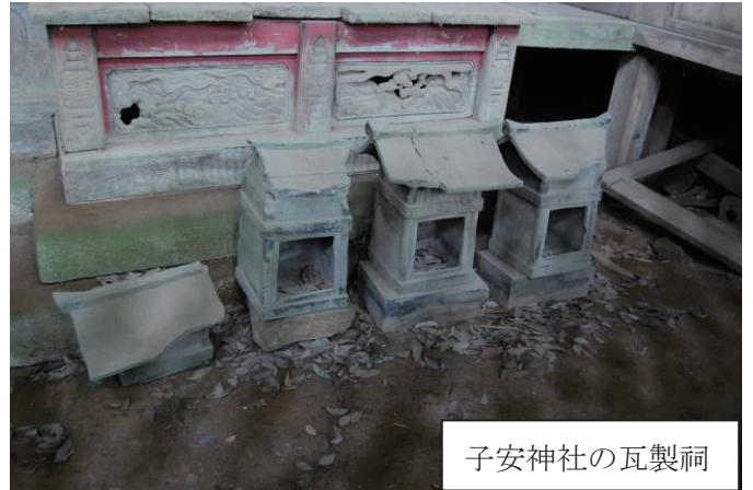
子安神社の瓦製祠