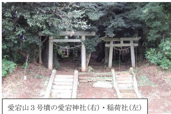
愛宕山 3 号墳の愛宕神社(右)・稲荷社(左)