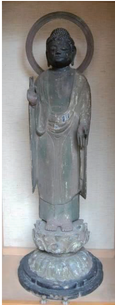
栗山宝蔵院の木造阿弥陀如来立像(県指定文化財)