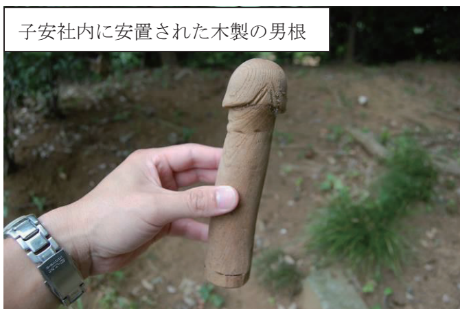
子安社内に安置された木製の男根