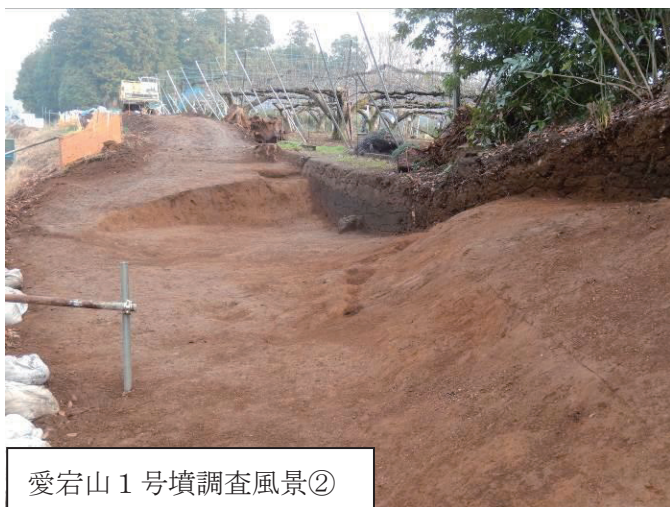
愛宕山 1 号墳調査風景②