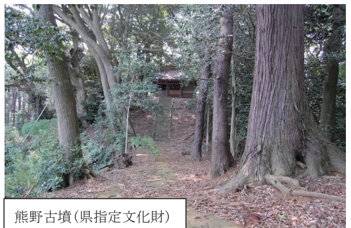
熊野古墳(県指定文化財)