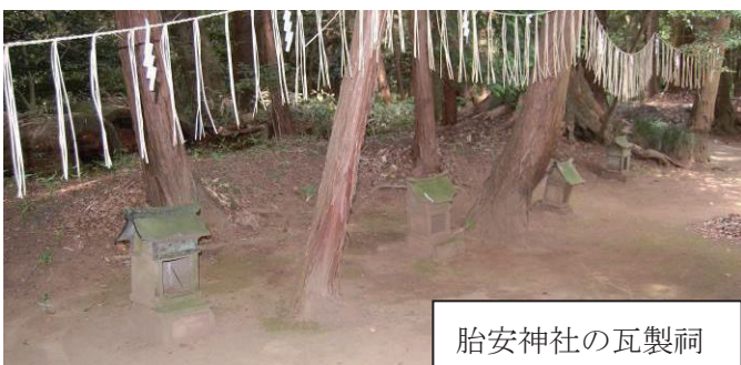
胎安神社の瓦製祠