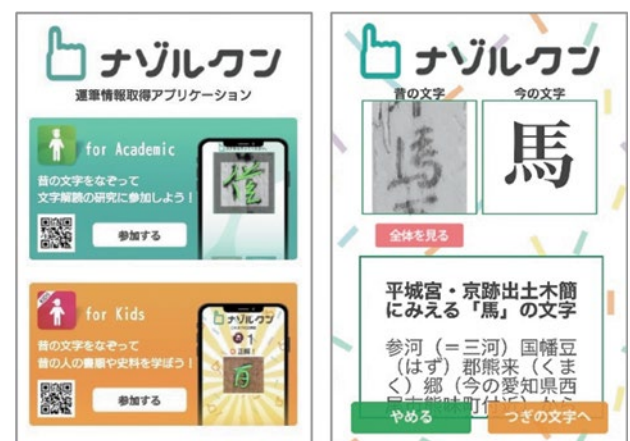
左：トップページ 右：Kids解説ページ