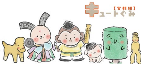
公式キャラクター キュートぐみ【宮都組】