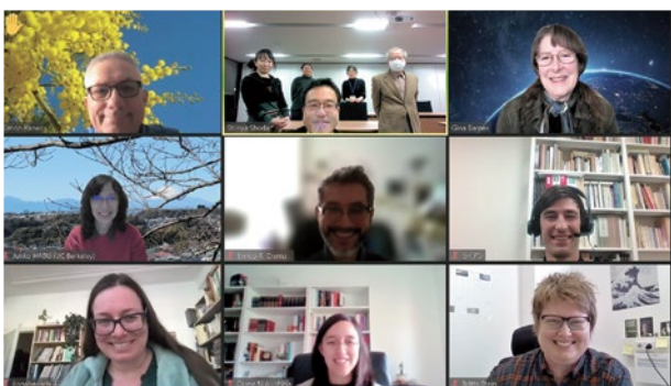
第6回リレートークの様子