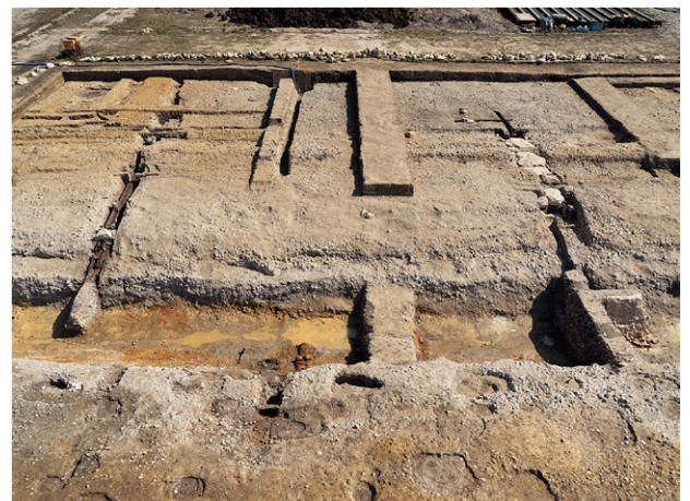
木樋暗渠(北)と石組暗渠(南)(西から)