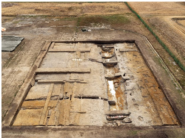
調査区全景(北から)