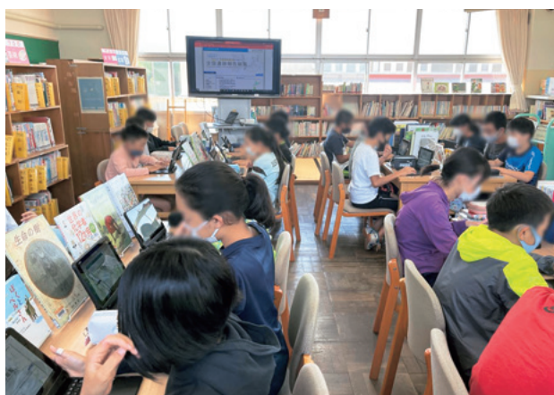
図1 全国遺跡報告総覧を活用した授業の様子

まずそれぞれが知っている学区内の城跡を出してもらったところ、一番馴染みのある「山吹城」が挙げられた。そのあとは学区ではないが町内にある「吉田城」「松岡城」など城跡の名前が挙げられた。原城は「はらんじょ」という地籍名としての認知がされているため、子どもたちはそれが城跡だとは思っていなかったことがわかった。そこで原城について簡単に解説すると、原城のある地区の子どもたちが反応