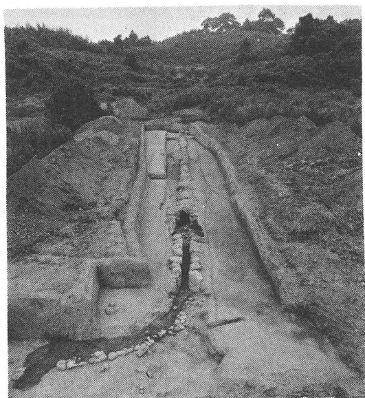
大石組暗渠（南より）

出土した遺物は、古墳時代から中世まで、かなり幅の広い時期にわたっている。土器類では、瓦器が多く、土師器、須恵器、黒色土器、緑釉陶器、磁器があり、そのほか、埴輪、瓦類、硯、滑石製有孔円板、玉類がある。