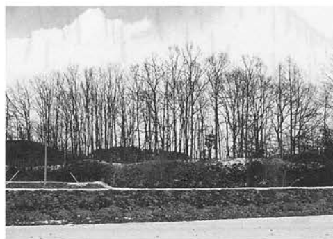
西側から土塁を望む