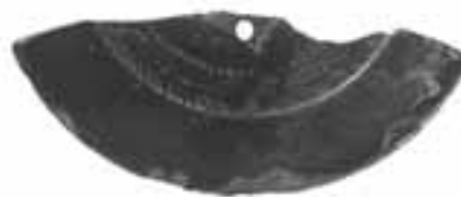
図 2 馬洗場B遺跡出土破鏡（内行花文鏡）