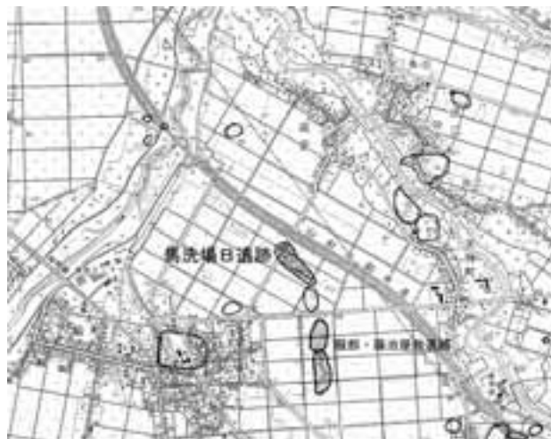
図 1 遺跡位置図

破鏡（図 2）は復元径 8.2cm を測る内行花文鏡で、1/3 強遺存している。平縁・斜行する櫛歯文・3 重の重圈文・直行する櫛歯文・内行花文が観察されるが、鈕及び鈕座は存在しない。内行花文は六弧の可能性が高い。破断面及び全体が研磨され 1 箇所穿孔が観察される。懸垂用と考えられる穿孔は破断面のほぼ中央に穿たれて