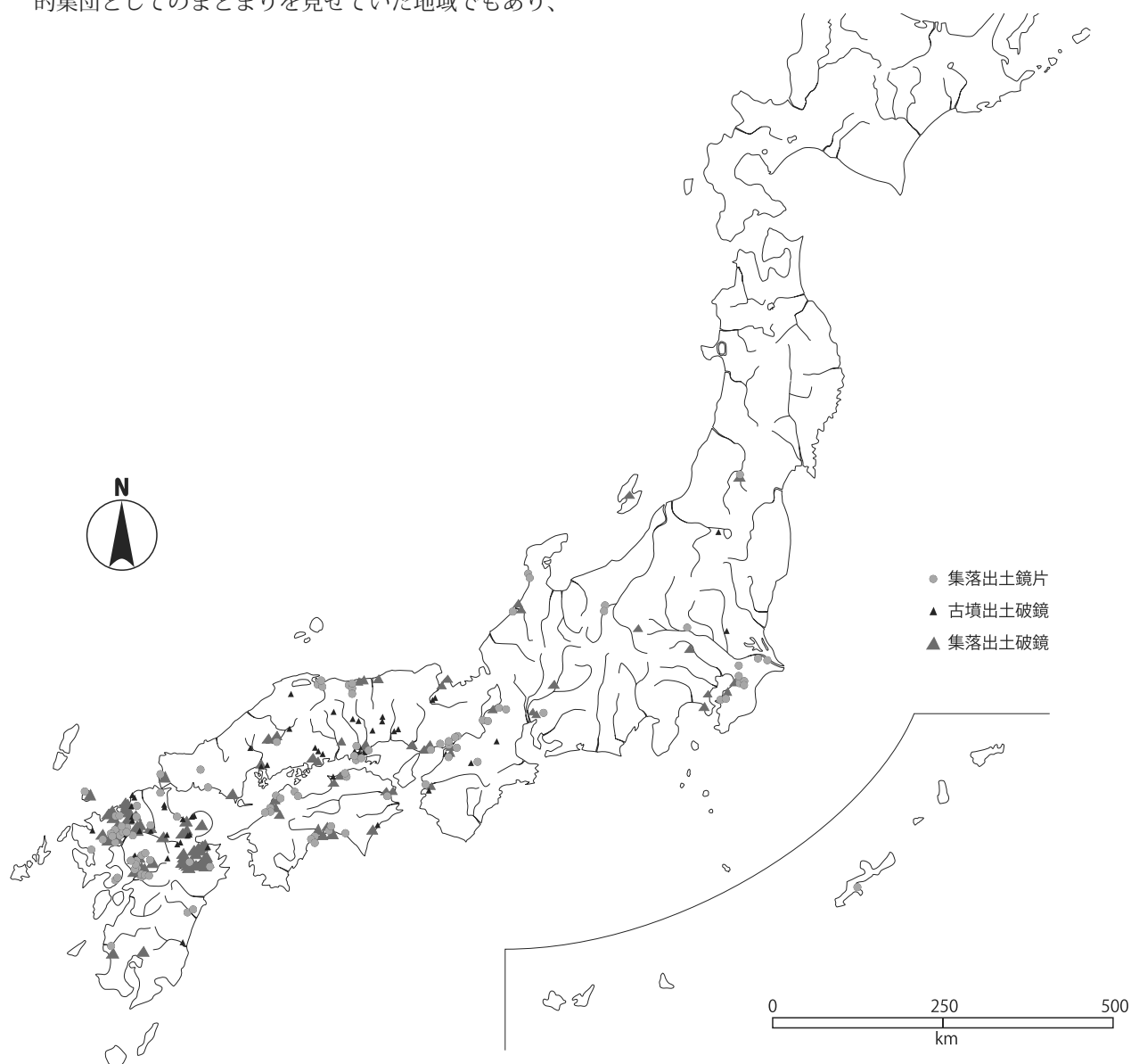
図4 破鏡・鏡片（集落出土）分布図

なお、本稿をまとめるにあたり、多くの方々から指導並びに助言を得た。また、多くの文献から引用させていただいたが、紙数の都合により、氏名及び文献名は割愛させていただいた。