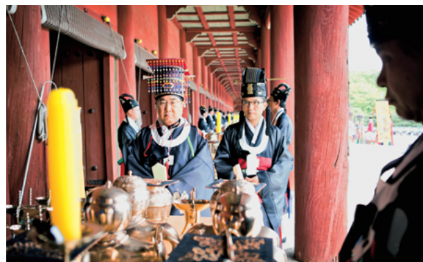
2016年宗廟大祭初献官 (神位に酒を三献捧げる時の最初の杯を捧げる官職 (正1品))