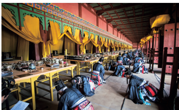
2016年宗廟大祭捧行 (神室)