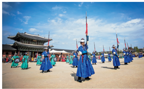
2017年景福宮での宮殿警備兵点検の儀式