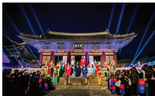
2019年宮中文化の祭典 昌慶宮 時間旅行