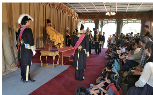
2017年徳寿宮外国公使接見礼再現行事