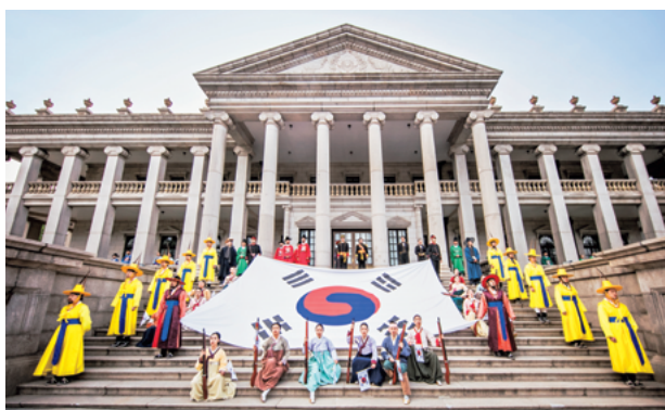
2019年第5回宮中文化の祭典 徳寿宮 時間旅行