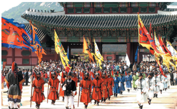
2002年守門將交代儀式