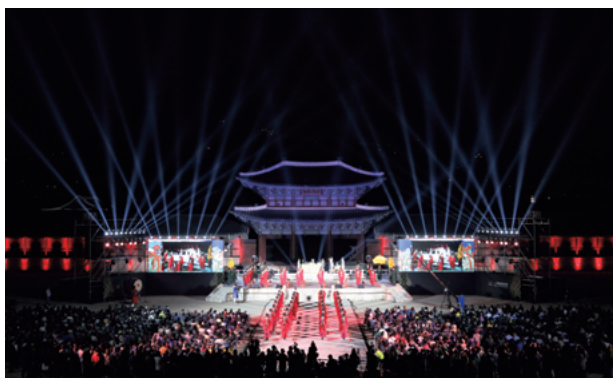
2017年宮中文化の祭典開幕式 (景福宮)