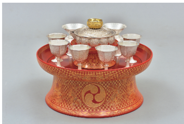
図5 三御飾御道具(一部)

道具類は、国宝に指定されている「琉球国王尚家資料」(尚家資料とする)の文書の中に記されている絵図を参考に、食籠などの漆器類と金杯銀杯などの金工品、年頭にしたためられる吉書などの書跡合せて47点の内、41点の復元を目指し、現在37点の模