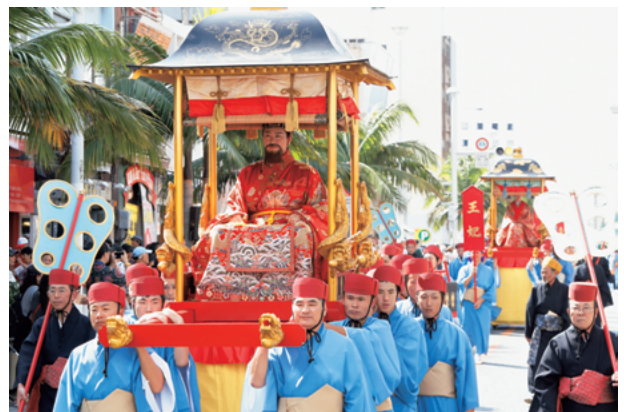
図2 首里城祭（琉球王朝絵巻行列）

正月の儀式は、正殿の中、御庭、南殿などいくつもの場所で長時間に渡り執り行われることが判明した。