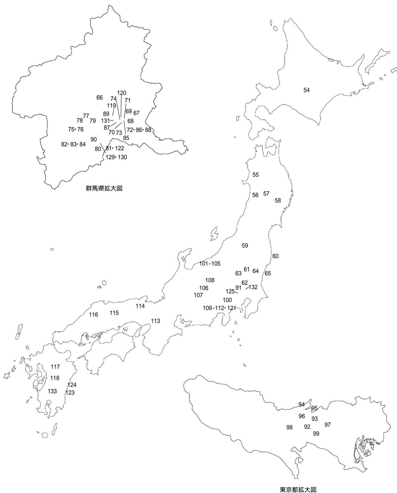
図2 全国環状ブロック群分布図