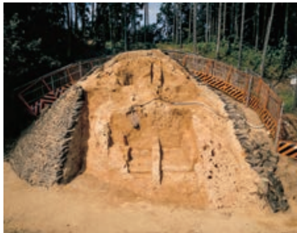
Fig. 6 平成 10 年度発掘調査時の墳丘

て 10cm 程掘下げている状況が確認できることから、基礎造成時に墳丘予定地を約 10cm 掘り下げ、墳丘の規模と位置を確定したと考えられる。また、この段階で排水用の礫詰め暗渠が設けられる。暗渠は下段墳丘の下部に位置し、地山から掘り込んだ幅 40cm、深さ 70cm の溝で、内部に径 4～10cm 程度の礫を充填している。基礎造成の版築と一連の仕事として設置されたものと推定される。