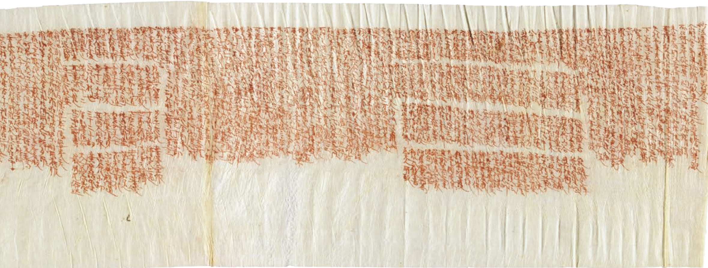
②妙法蓮華經卷第二 巻首

下のお経は朱で書いてありますが、朱は血を表現しています。自分の血を朱に混ぜて書くこともありました。このお経には、縦に細かいシワが無数に入っており、巻くときに力を込めて細く巻いたことがわかります。また、普通、巻物は左奥から右端に向かって巻いていくはずですが、このお経は逆に、書いた順に、右端から左奥に向かって巻いています。