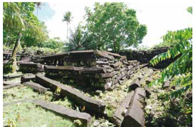
ナンタワスの内部にある石室

それぞれの人工島の間には水路が網の目のように張り巡らされており、引き潮の時には歩いて渡ることもできますが、満ち潮になるとボートやカヌーで行き来することとなります。