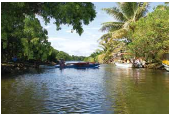
人工島の間をめぐる水路

それぞれの人工島の間には水路が網の目のように張り巡らされており、引き潮の時には歩いて渡ることもできますが、満ち潮になるとボートやカヌーで行き来することとなります。