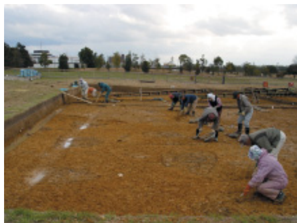
発掘調査の作業風景（北から）