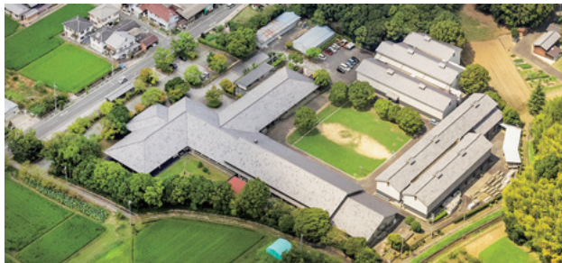
都城発掘調査部（飛鳥・藤原地区）庁舎 南東から Department of Imperial Palace Sites Investigations (Asuka/Fujiwara)

634-0025 奈良県橿原市木之本町94-1 Tel.0744-24-1122 (代表) / Fax.0744-21-6390 94-1, Kinomoto-cho, kashihara City, Nara Prefecture 634-0025 Japan