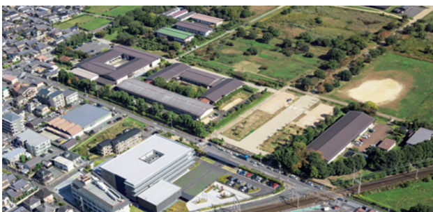
平城宮跡資料館と収蔵庫群 南西から Nara Palace Site Museum, Storage facilities