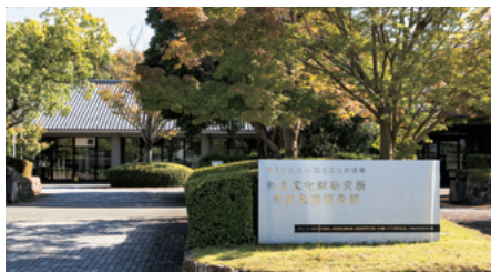
庁舎エントランス Division Headquarters entrance