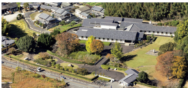
飛鳥資料館 南東から Asuka Historical Museum

634-0102 奈良県高市郡明日香村奥山601 Tel.0744-54-3561 (代表) / Fax.0744-54-3563 601, Okuyama, Asuka Village, Takaichi County, Nara Prefecture 634-0102 Japan