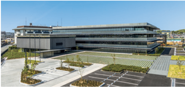
奈良文化財研究所本庁舎 南東から Headquarters Building

630-8577 奈良県奈良市二条町二丁目9番1号 Tel.0742-30-6733 (総務課) / Fax.0742-30-6750 2-9-1 Nijo-cho, Nara City, Nara Prefecture 630-8577 Japan