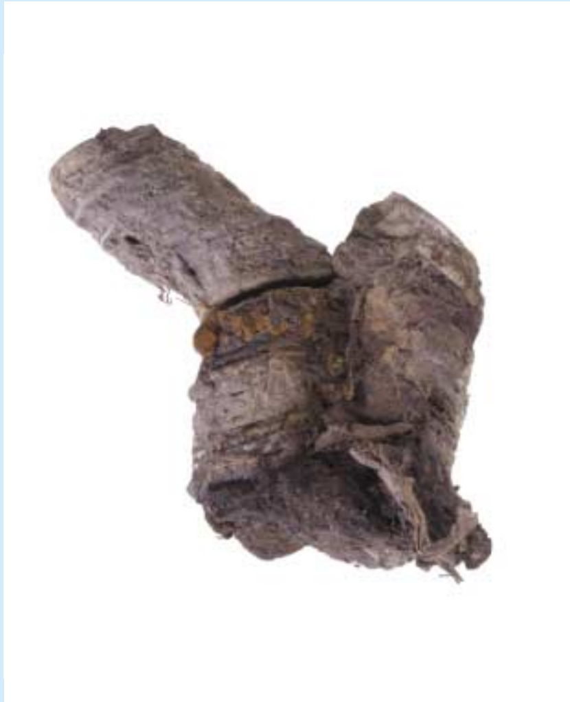
写真1： さしげに 纏銭〔原寸〕