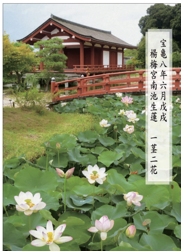
図2 双頭蓮の合成写真

この場所の庭園は『続日本紀』に一回だけ記載がある。奈良時代末期の光仁天皇の時代、宝亀8年6月18日に、楊梅宮南池に蓮が生じ、一つの茎に二つの花が咲いたという祥瑞の記事である。この当時、東院は楊梅宮と呼ばれており、反橋脇の入り江の池底のみが石敷きではないため、ここに蓮が植えられていたと考えられる。現地は遺構を露出した築山石組などがあり、盛土は最小限にしているため入江に根の深い蓮を植えることができずカキツバタなどを植栽している。このためミニ講演では祥瑞やその背景にある天人相関思想、奈良時代における祥瑞の政治的利用などの説明と合わせて、当時をイメージしてもらう合成写真を配布資料に加えた（図2）。合成写真の作成は記録と場としての遺跡を繋ぎ、価値をわかりやすく伝えるインタープリテーションの一