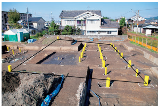
図4 建物Dの様子（南より）

い飛鳥時代以前の大王の宮などの原形があると考えられることから、周辺地区における一連の調査は我が国における国家の形成過程を探る上で極めて重要な意義を持つものと言えよう。