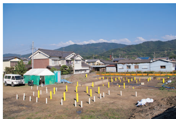
図8 現地説明会時の柱の表示（南西より）

実際の柱に用いられた樹種は、残念ながら発掘調査では明らかにすることができなかったため、入