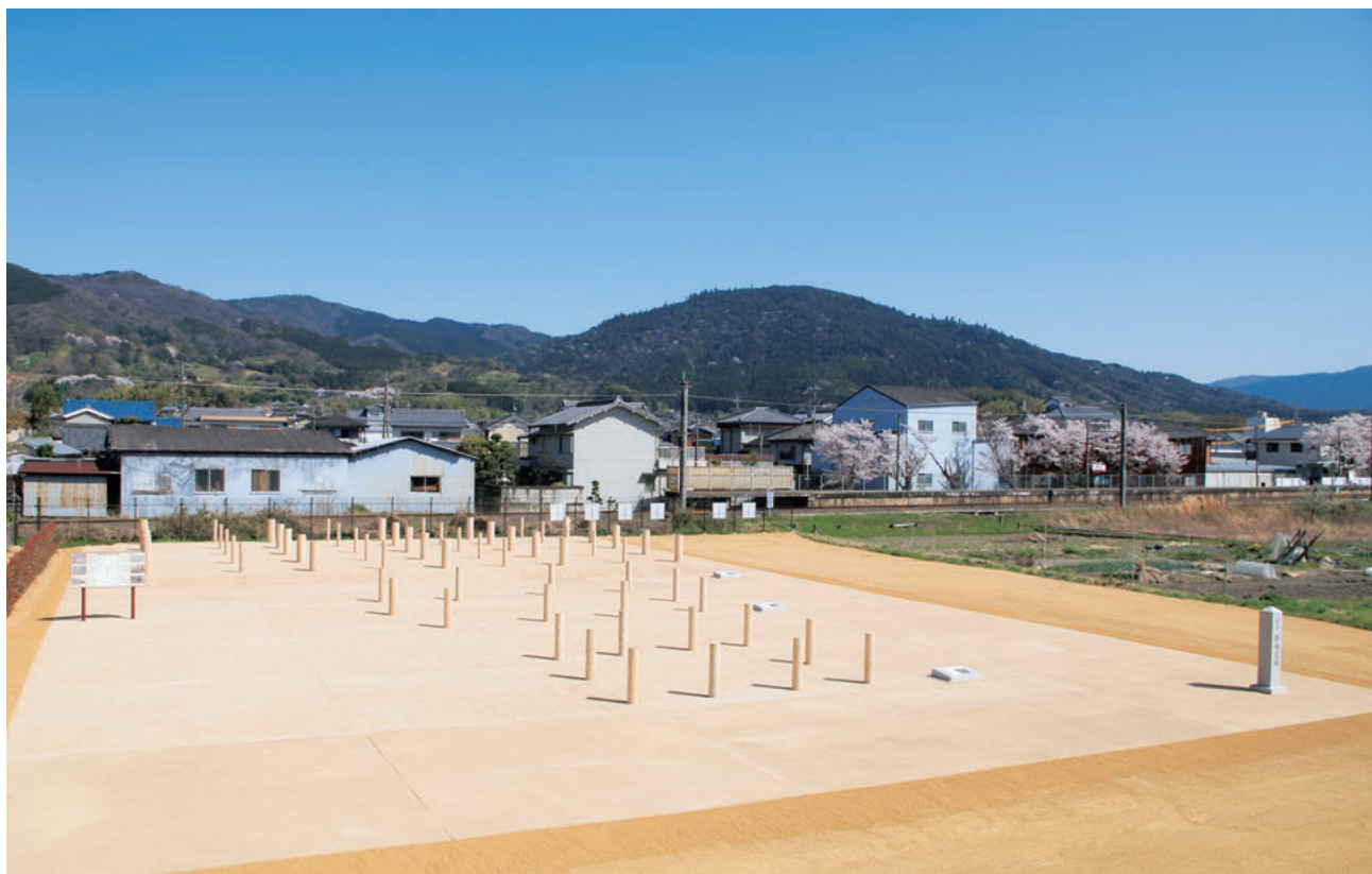
図10 表示された建物群（西北より）