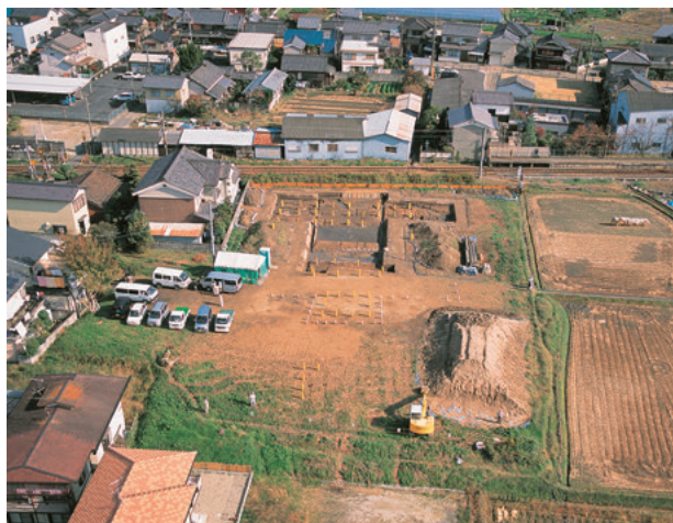
図3 辻地区調査地全景（西より）

纏向遺跡の居館構造は弥生時代から古墳時代への変革期における権力構造や社会の大きな変化を窺うことができるものであるとともに、未だ明らかでな