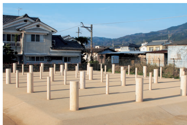
図9 表示された建物Dの柱（南西より）