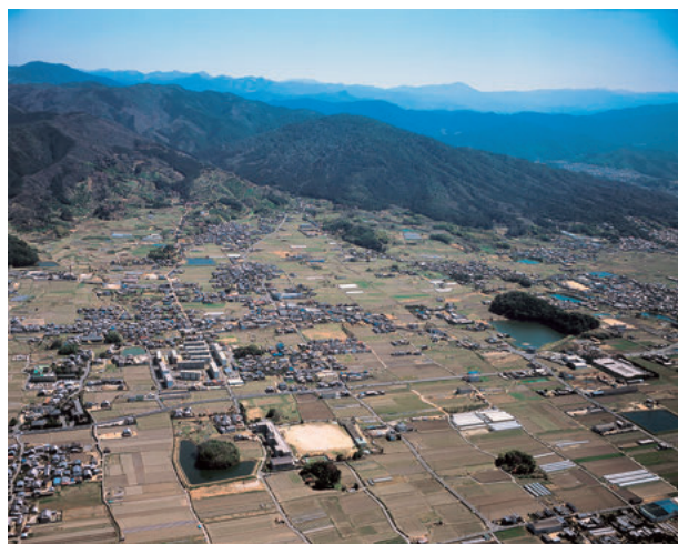
図1 纏向遺跡の様子（西北より）

建物群は埋没河川に挟まれた微高地上から検出されている。この微高地の西隣接地からは昭和46年（1971）の調査で「纏向型祭祀土坑 4) 」の代名詞と