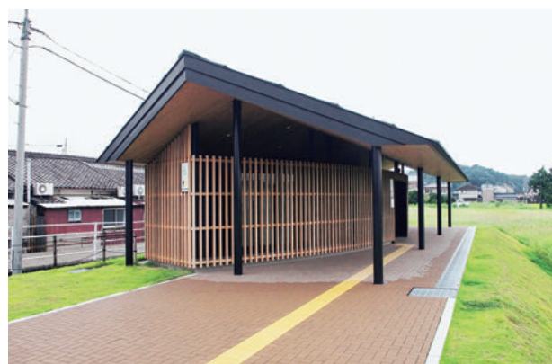
図5 太田地区の便益施設

便益施設は平屋の鉄骨造りで、床面積は約100㎡、多機能トイレにはオストメイトなどの最新の設備を設置している。また、建物内壁や天井面はすべて地元産材である吉野杉の天然木板を張付けるとともに、外装にも吉野杉を用いた縦格子を設置し、木のぬくもりと清潔感を引き出している（図5）。