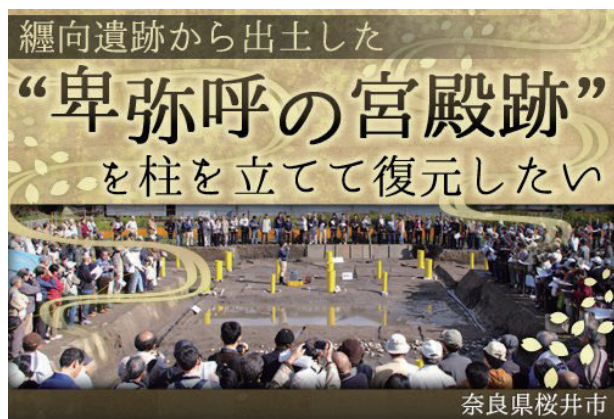
図6 GCFのWebサイトのバナー