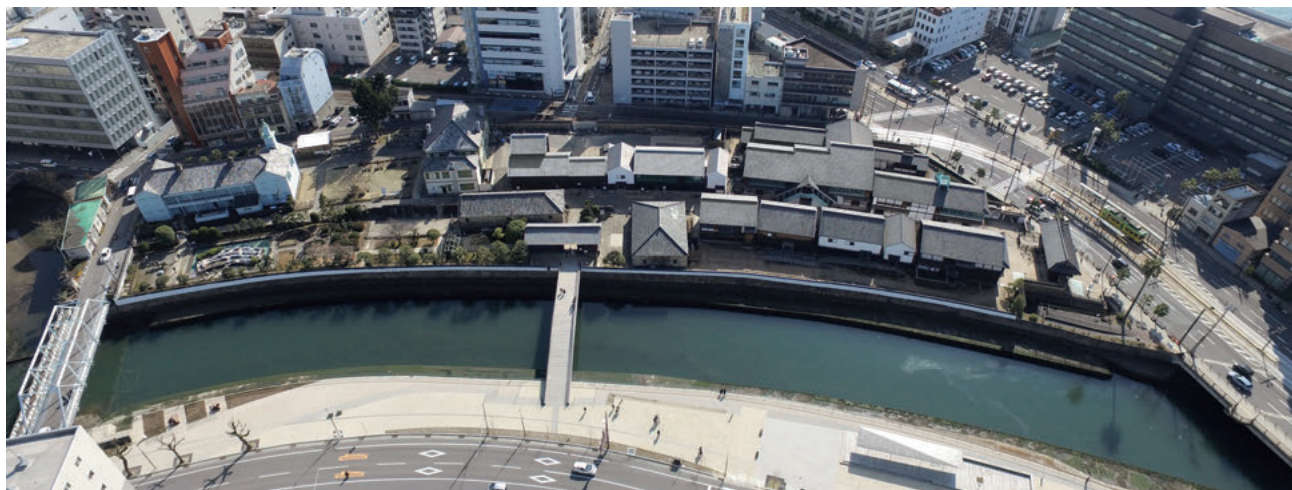
図1 出島全景 平成30年度撮影

築造当初はポルトガル人が入居したが、寛永16年（1639）にポルトガル船の来航が禁止されると、ポ