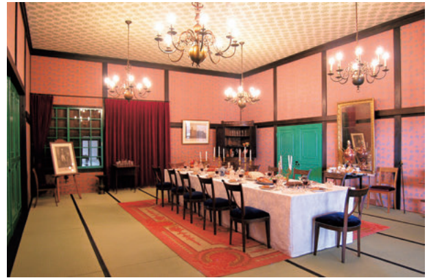
図6 カピタン部屋 大広間の再現

これらの調査成果に基づき、南側及び西側護岸石垣の修復整備を行った。検出した状況のとおり石垣の積み直しを行うことを基本とし、さらに上段の石垣が欠損している箇所については、既存の石垣を手本としながら、新補材による復元を実施した。石垣は往時から今に残された遺跡の一部であり、出島和蘭商館時代の遺構が地表に残されていない現状において本物の遺構であるため、調査から整備にかけて出島の石垣がもつ特徴を損なうことがないように十分な配慮を行った。現在、出島の南側外周に歩道を設け、整備された石垣を安全に観覧出来るようにし、石垣の上には、高さ9尺の練堀を設置し、囲われた