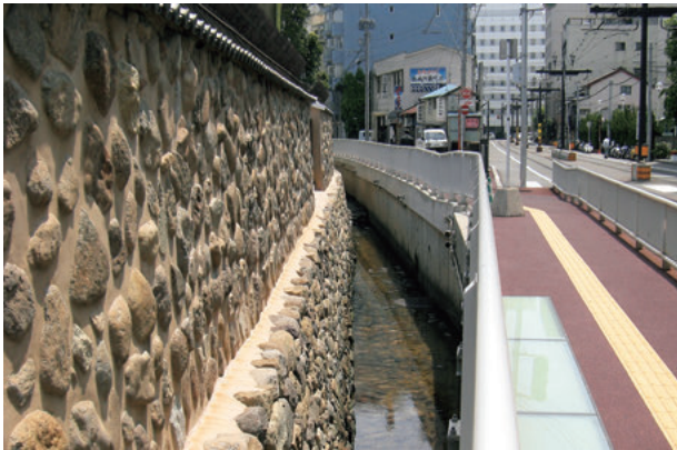
図5 南側護岸石垣整備後の状況

業が計画され、出島の西側及び南側護岸石垣の一部を顕わにし、修復する整備工事が行われた。