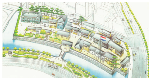
図2 短中期復元整備計画予想図