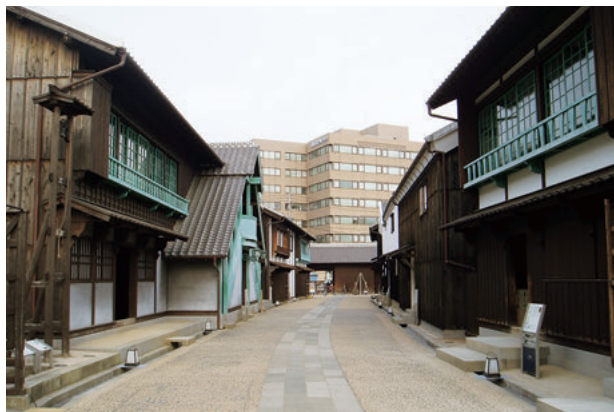
図3 出島の通り 復元された江戸期の町並み

その後連続した町並みの整備を目指し、平成13年から、隣接地を計画地とした第Ⅱ期事業に着手した。第Ⅱ期には、カピタン部屋、乙名部屋、三番蔵、拝礼筆者蘭人部屋、水門の5棟が復元された。商館長の居宅であったカピタン部屋は、出島の中心となる施設で、規模も最大の建物であったため、間取りや