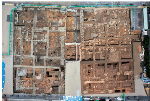
図4 出島中央部発掘調査地点全景