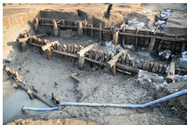
図3 日本最古のドライドック遺構

三重津海軍所跡の近代化産業遺産としての価値については、平成13年から現在も継続実施している発掘調査や平成21年度から実施している文献調査などによって明らかにされてきた。特に、蒸気船の修理には不可欠であったドライドックが、木杭と板を組み合わせた在来の土木工法により構築された国内現存最古の事例（図3）であること、修理に使用する金属部品製造についても、日本古来の鋳物や鍛冶の