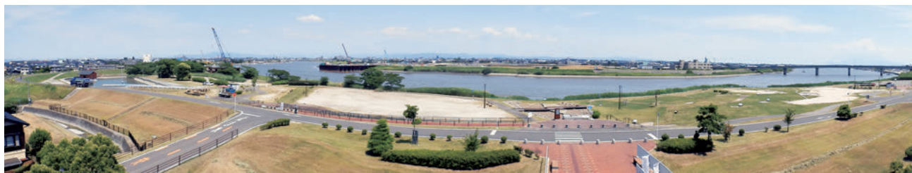
図5 三重津海軍所跡 近景

における議論をとおして、このような課題に対処する経験値も上がっており、価値の伝達における正確性と娯楽性に効果的な折り合いをつけることは十分可能であると考えている。