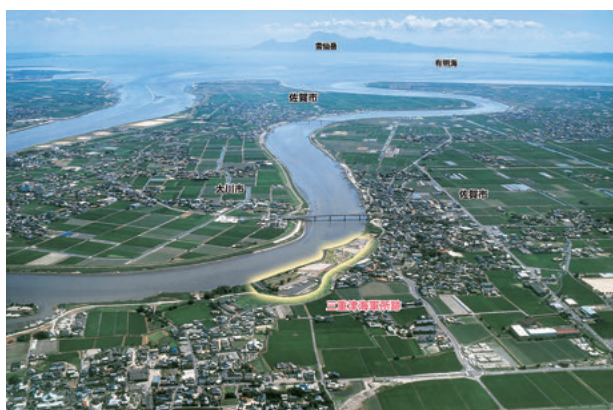
図2 三重津海軍所跡 遠景

三重津海軍所跡は、佐賀市の南部域にあり、有明海に注ぐ筑後川の分流早津江川の西岸河川敷に立地する。現在の早津江川河口からは約6km上流、佐賀城跡からは直線距離でおよそ5kmの位置にある（図1、2）。遺跡の対岸は福岡県大川市で、当時は柳川藩領であった。