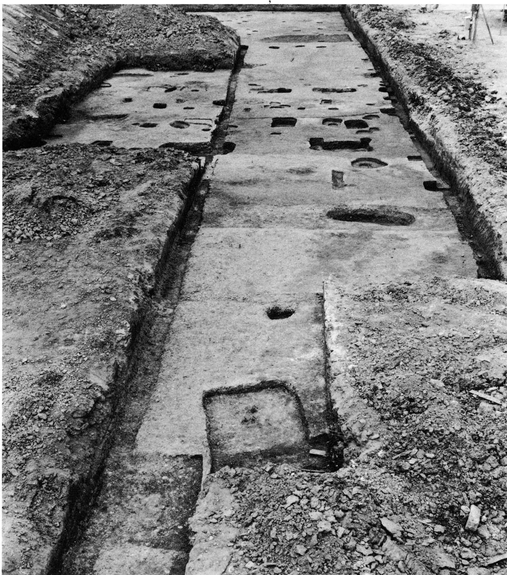
2. 東四坊々間路と西半部の遺構（西から）