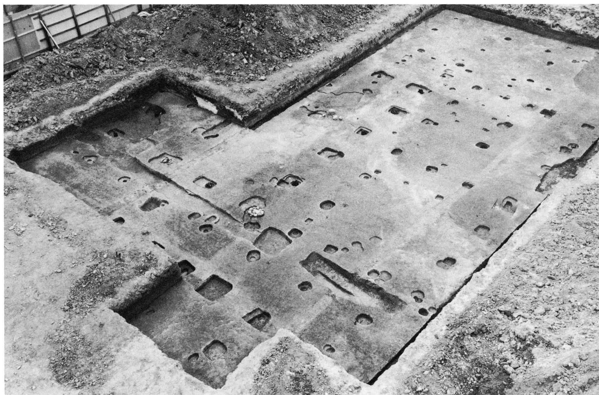
2. 調査区東半部の遺構（北西から）