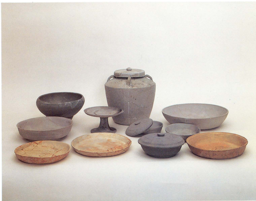
1. 天平時代の食器構成