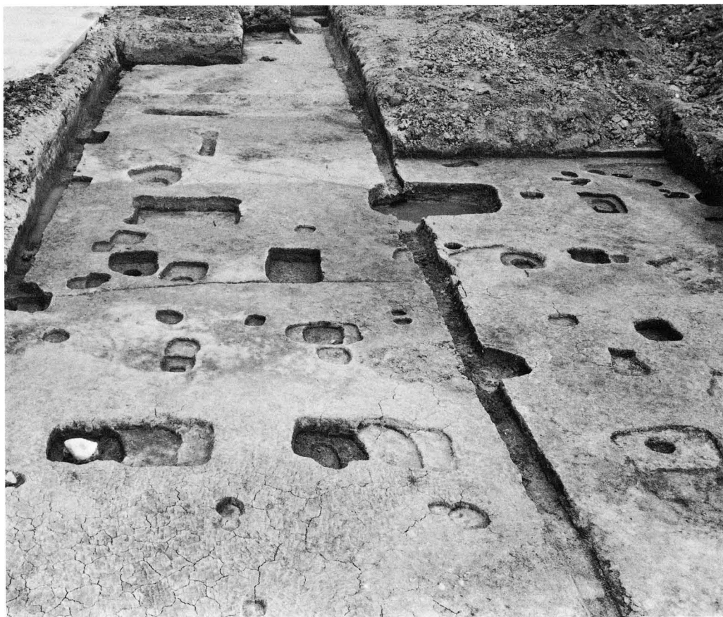
2. SB2395・SA2405 (東から)