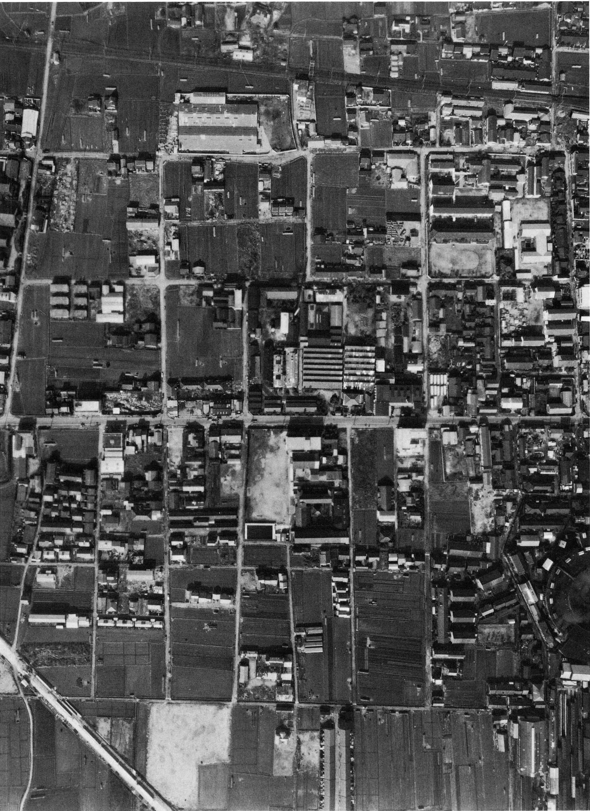
調査地周辺航空写真（昭和37年撮影 1/3000）