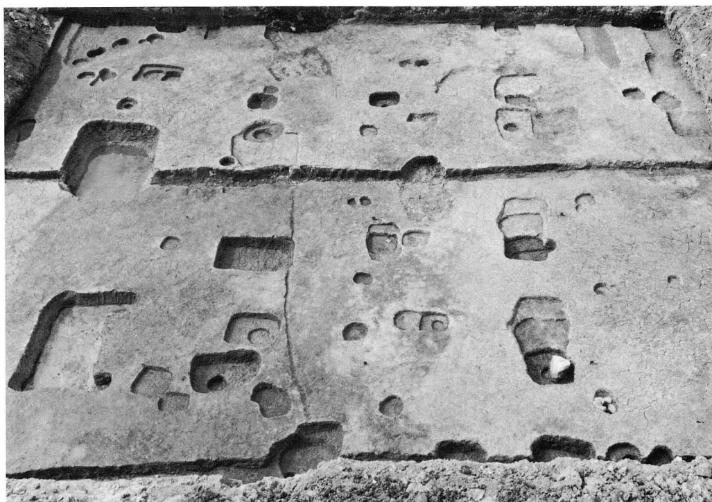
1. SB2395・SB2396・SA2405 (南から)