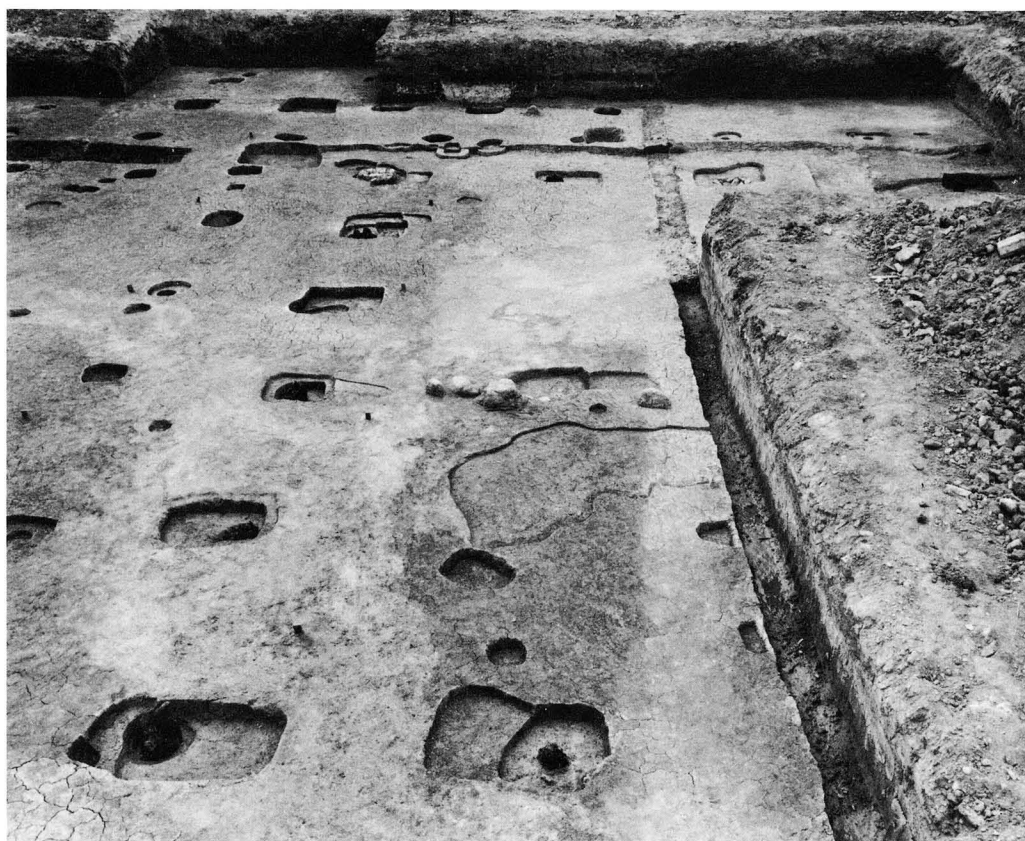
2. SB2390 (南から)