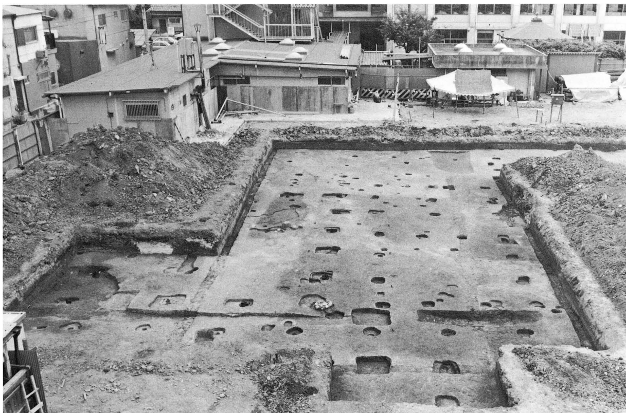
1. 調査区東半部全景（北から）