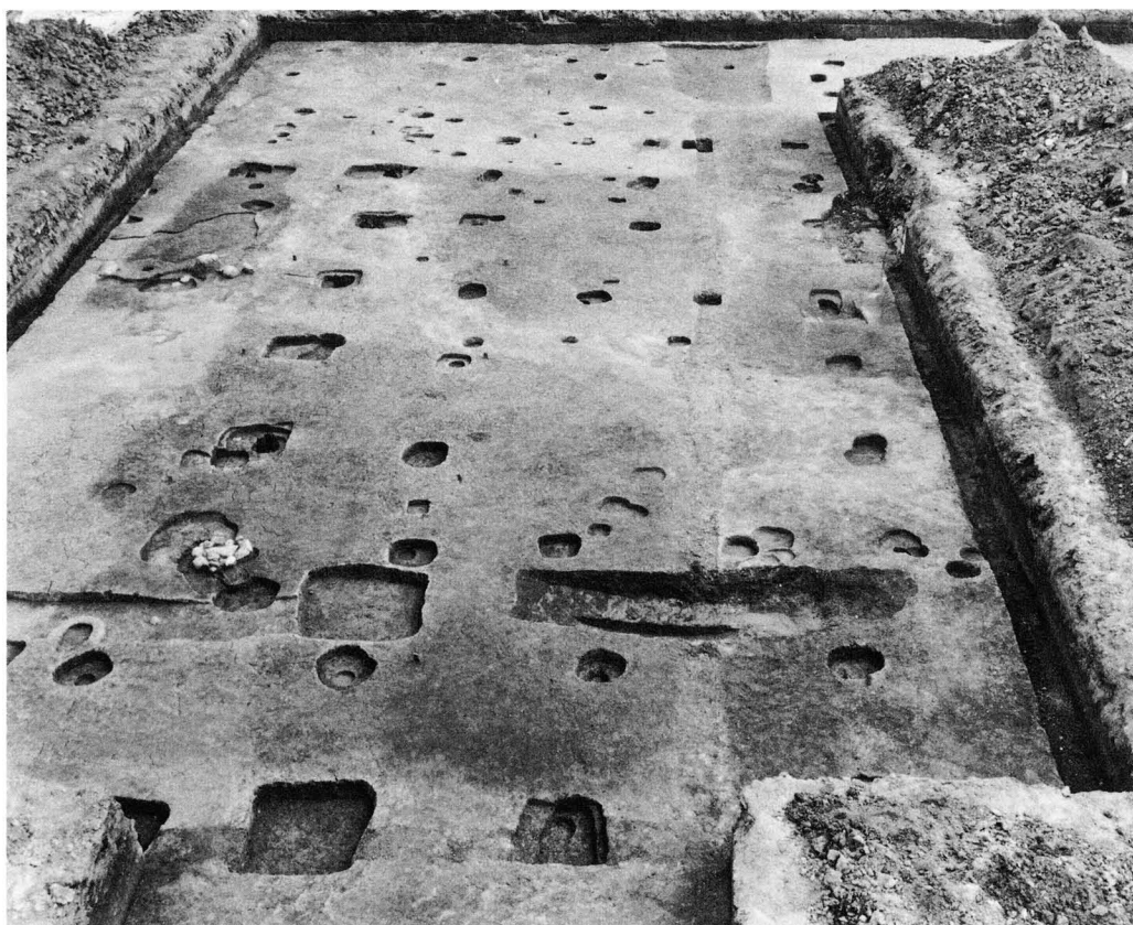
2. S B 2392・2393 (北から)