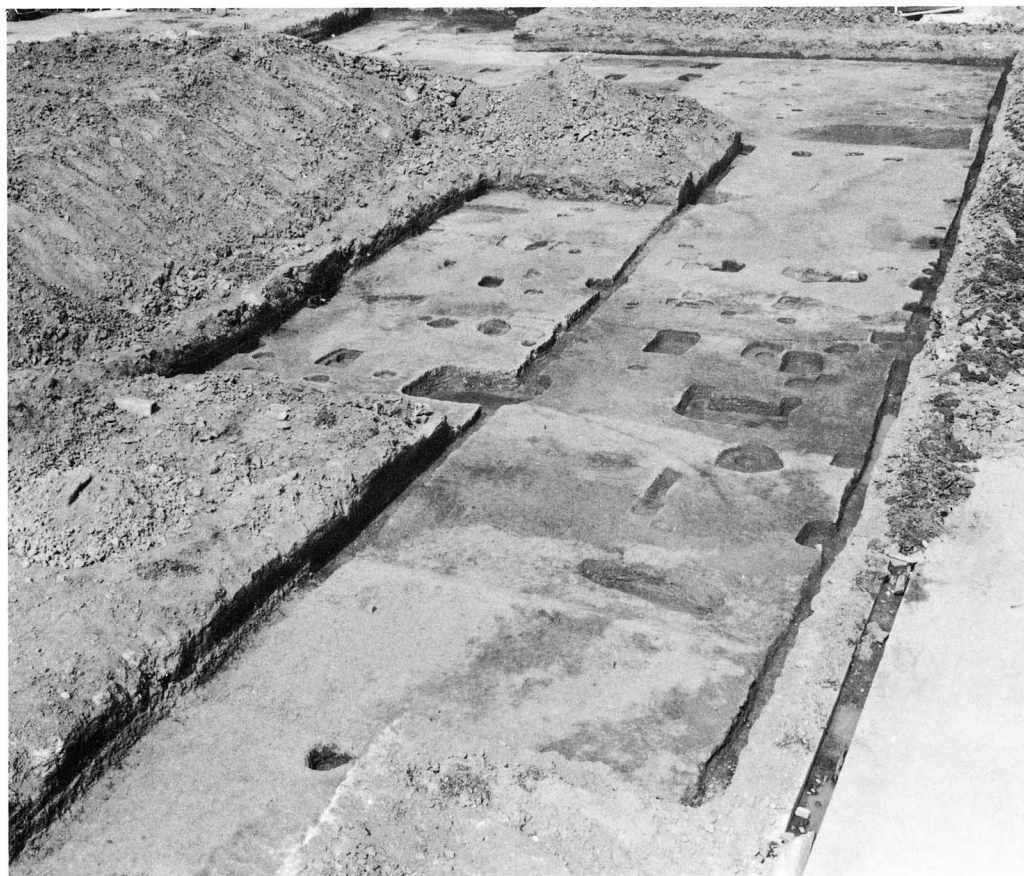
2. 調査区西半部の遺構（西南から）