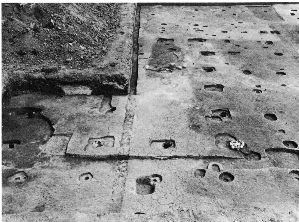
1. S B 2390 (北から)