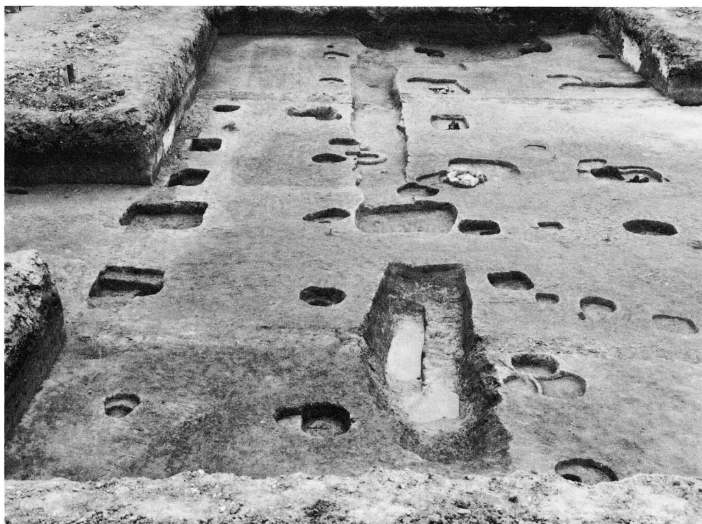
1. SD2401・SA2402 (西から)