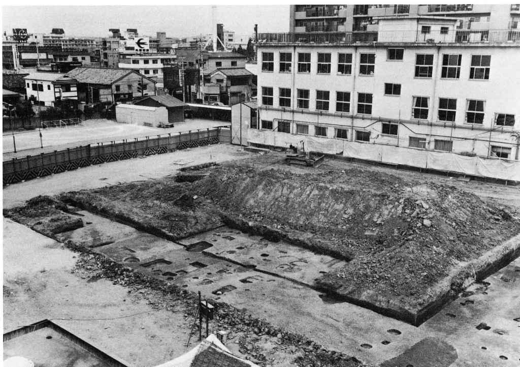
1. 調査区西半部全景（南東から）