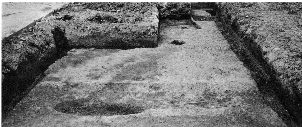
1. 東四坊々間路（東から）