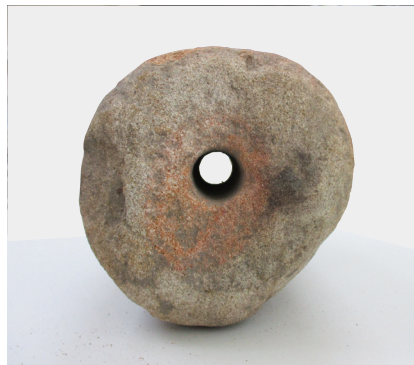
写真 1 岐阜県関市平和通四 古町遺跡 表採 石製鞆の羽口（関鍛冶伝承館所蔵、左：外形で右側が先端側、右：先端側断面形） ほぼ完形品で、長さ 18.8cm、外径 10.5cm ～ 11.3cm、孔径先端側 2.2cm、基部側 4.2cm、断面少し面取りがある円形