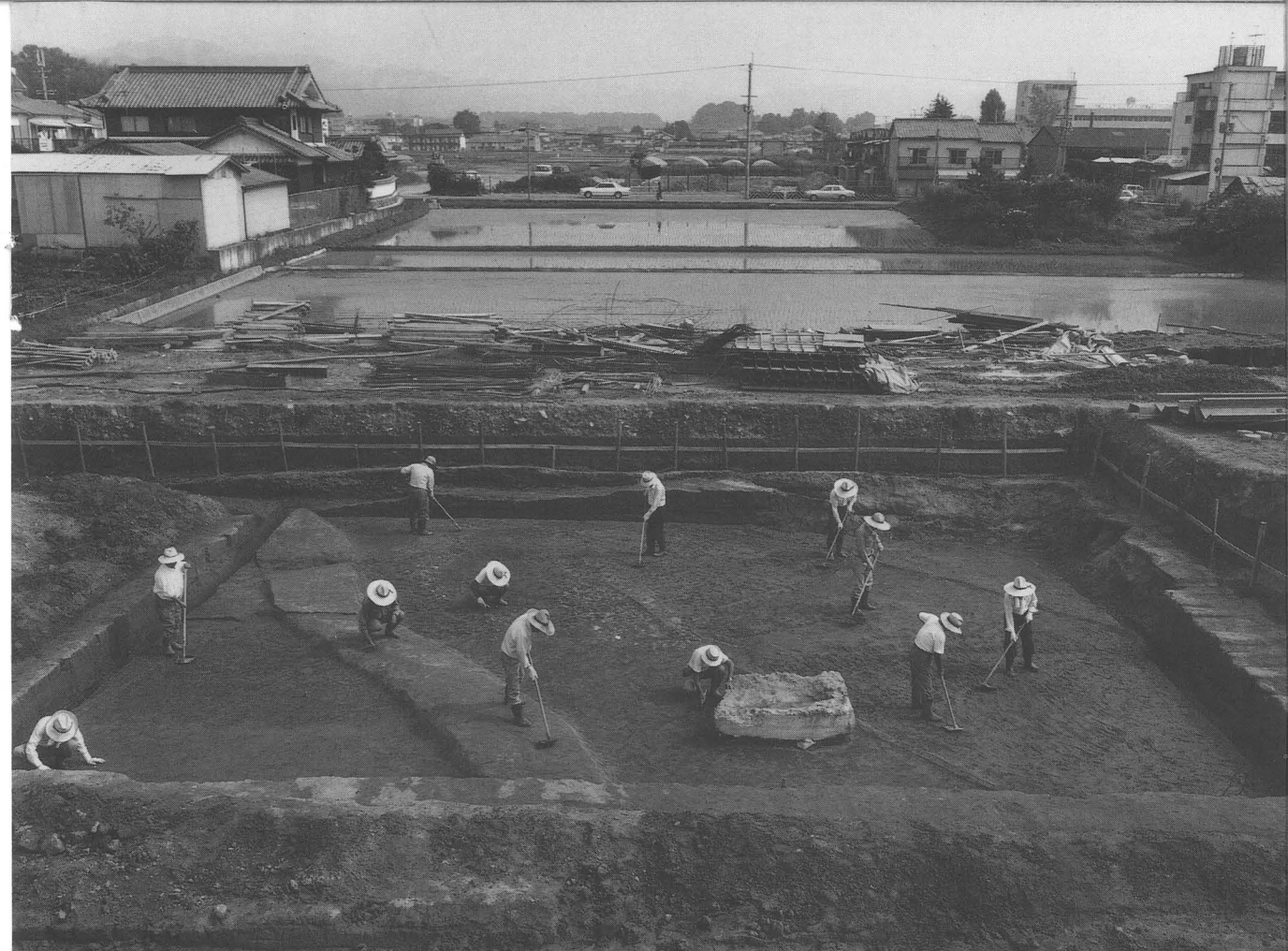
弥生時代の水田・現代の水田（第60—3次調査）