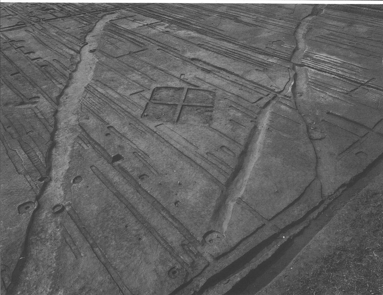
↑ 藤原宮大極殿院東方（第58次調査）