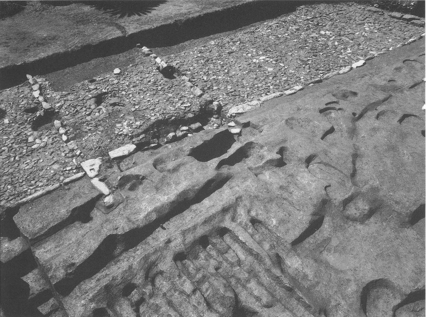
奥山・久米寺金堂