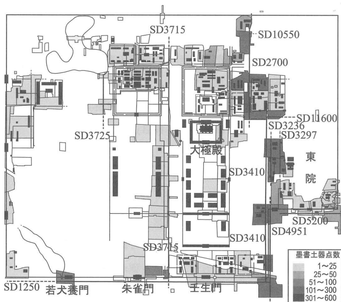
Fig. 9 平城宮内墨書土器の出土量