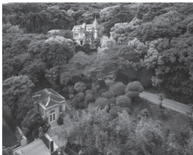
図45 敷地全景（南東から）

らおりの道路によって連絡される（図45・47）。築造年代は、萬翠莊が建設された大正11年（1922）である。土地の造成にあたっては、家老屋敷時代に掘削されたと伝えられる近世の井戸が上段に残ることなどから、概ね近世の地割を踏襲したと考えられる。作庭者は不明だが、バラの栽培を趣味とし園芸に造詣の深い人物であった当主の久松定謨の意図が反映されたとみられる。現在の萬翠莊庭園は、その後の萬翠莊の利用変遷にともない、幾度かの改修を経ている。古写真や工事関係資料からわかる大きな改修には、年代は不明であるが、中段の西1／3を埋め立て上段を東に拡張したとみられる工事と、愛媛県立美術館分館となった翌年、昭和55年（1980）の庭園改修工事がある。 本館前庭 本館前面のテラス状に張り出す土地につくられる。本館からの眺望と、松山市街から本館が仰ぎ見られる配置を意識した正面性の高いつくりである。本館玄関ポーチ南の車廻しには、主景木としてソテツが植栽され、本館正面左右にはヒマラヤスギが列植される。ヒマラヤスギは、明治12年（1879）頃に渡来し 1) 、明治後期以降に公園や洋風庭園に好んで植栽された樹木である。これらヒマラヤスギとソテツが、建物の外観と一体となって本庭園の顔となる景観を構成している。車廻しの南側は、昭和55年（1980）の改修工事によって全面が芝張の開放的な空間となった。古写真にみる当初の前庭は、芝地に魚子垣で仕切られた園路を設け、既存のマツやサクラを活かしつつ、点々と刈り込みの低木が配されるものであった。既存樹や近世の石組井戸など、萬翠莊建設以前の要素を残しながら、新たな植栽を導入することで、洋館のたた