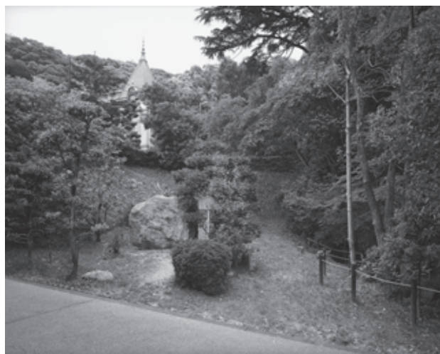
図46 中段現況（南東から）