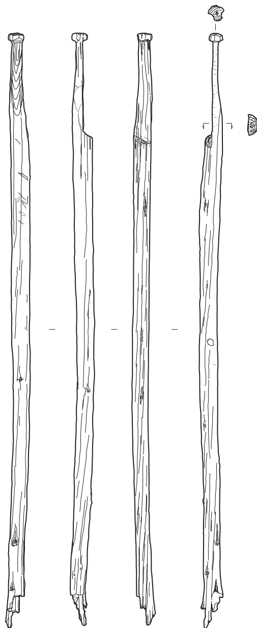
図90 斜めの欠き込みをもつ部材 1 : 15