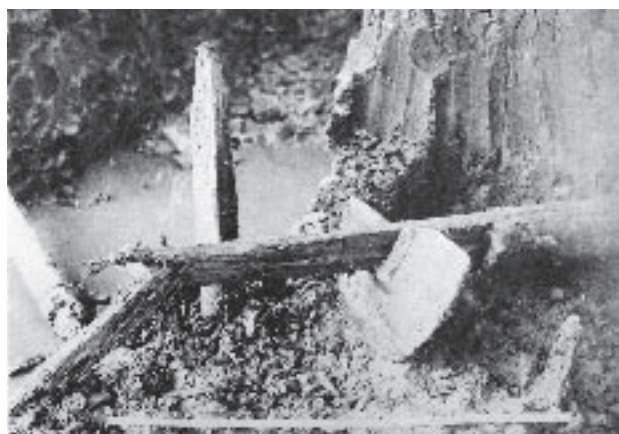
図88 鼠返しと柱の出土状況（『菰山町史』より転載）

全長231cm、直径7.2cmの心持ちの丸太材で、端部をノミで有頭状に造り出す。もういっぽうの端部は折れており、当初の全長はさらに長かったと考えられる。有頭状に造り出す端部は先端から39.5cmのあたりで斜めに落とすところまで、丸材を半裁した上で、チョウナで丁寧に仕上げている（図91）。側面にはノミをあてたと考えられる痕跡があるが、意図は不明である。ほかには、顕著な