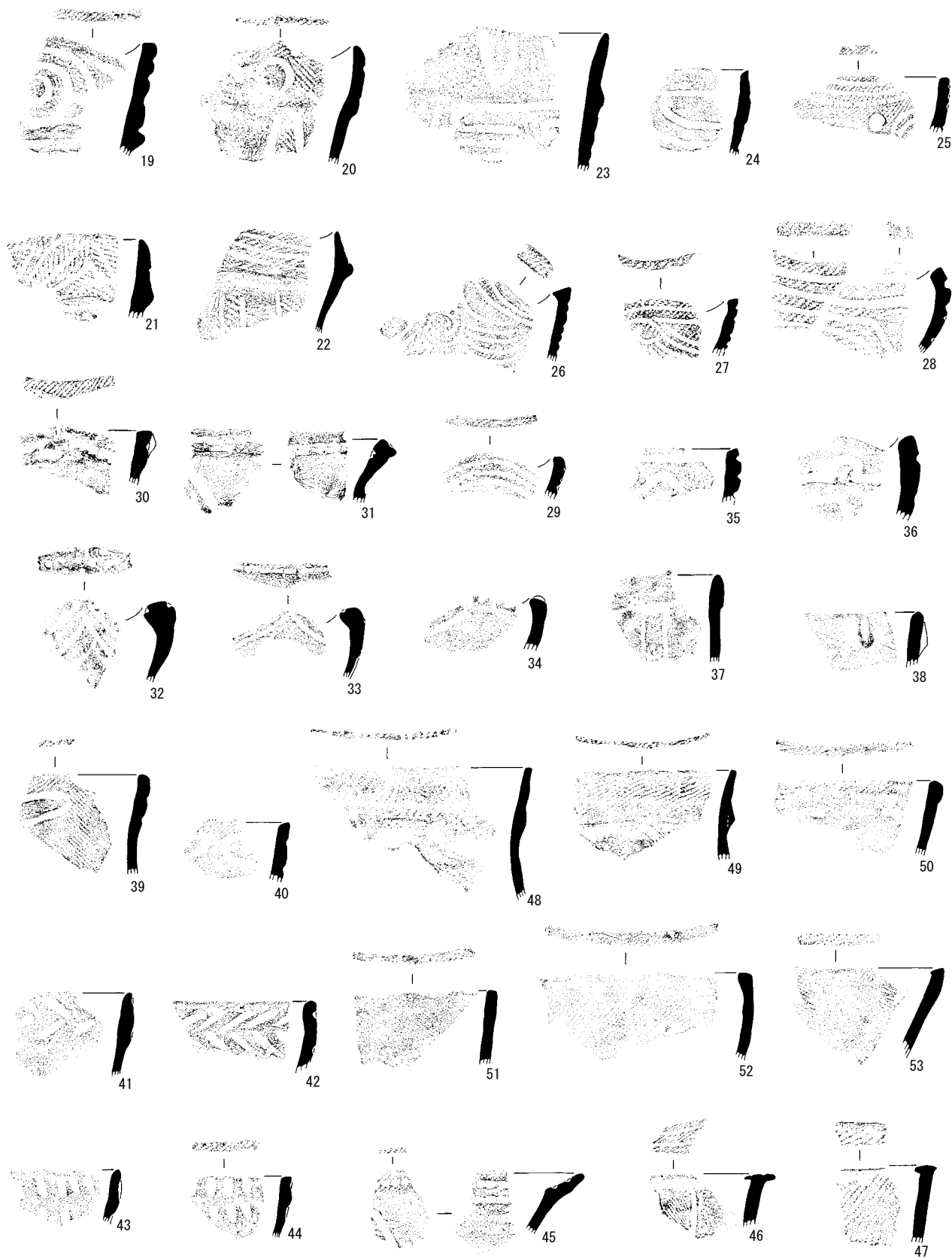
図37 中期末～後期初頭の土器 1 1 : 4