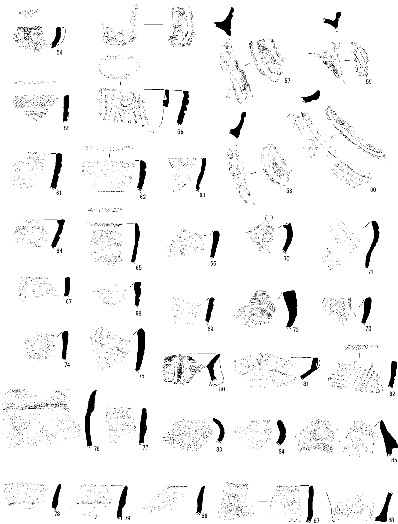
図38 中期末～後期初頭の土器2 1:4