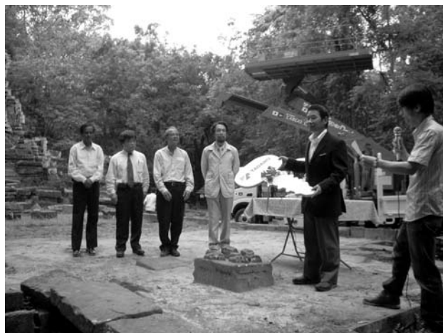
図17 (株)タダノによる提供資材の贈呈式

本年度は当初、8月と12月に二回の発掘調査を実施する予定であったが、12月にはタイにおける騒擾のため研究員2名がカンボディアに入国できず、発掘調査を実施できなかった。そのため翌2月に、これまでの