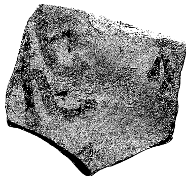
図102 「飛」墨書土器 1:1

これまで寺域東辺部では小規模な調査が数多く行なわれているが、全体の状況は未だ判然としていない。今調査区の約20m北方で、奈良時代から平安時代初頭にかけての石組溝と瓦敷きが検出されており(飛鳥寺1987-1次調査)、今回もほぼ同じ深さまで掘下げたが、それらとの