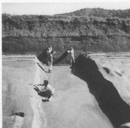
図63 藤原宮南面外濠（西から）