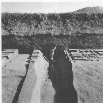
図64 藤原宮南面内濠（西から）