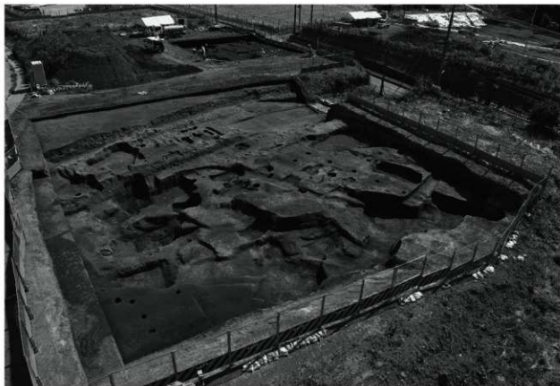
1. ピア 17（上り）区 中世面全景（北から）