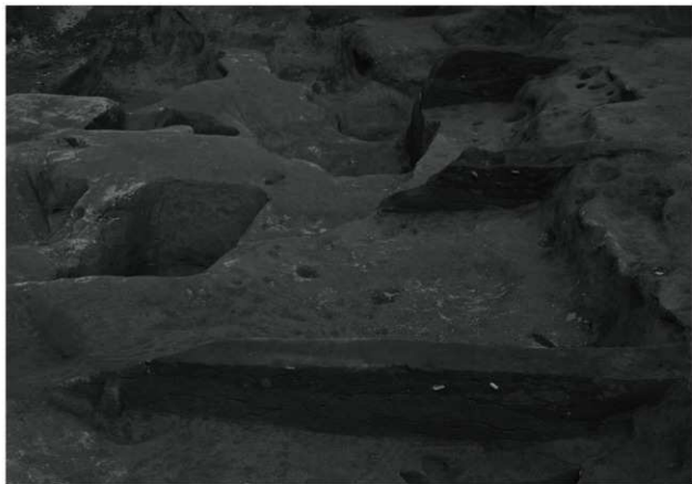
1. C 4 号構土層 (西から)