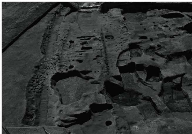
1. K1号溝・C4号溝・C2段切全景(東から)