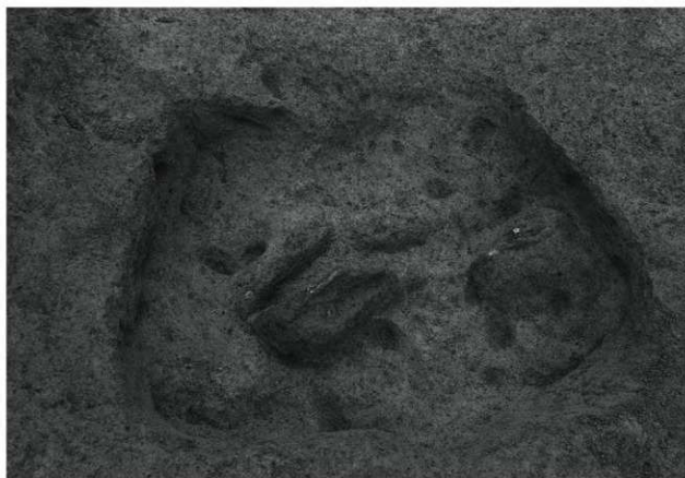
2. C17号土坑全景(西から)