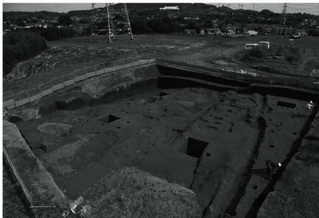
2. ローム上面全景（南西から）