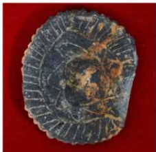
① 鏡形(釧形)土製品(弥生時代末～古墳時代初)

L 字形石杵と呼ばれる、赤色顔料(水銀朱)を細かく砕くために使われた石製品も出土しました。福井県では3例目で、弥生時代後期から終末にかけて西日本一円で共有された祭祀形態が日本海側にも及んでいたことを裏付ける、貴重な発見です。