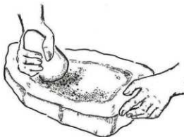
参考:石杵の使用方法