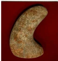
② L字形石杵(弥生時代末～古墳時代初)