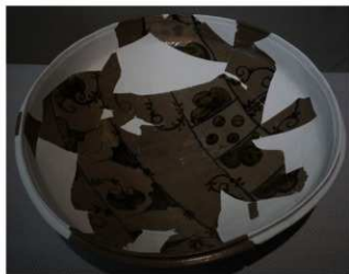
① 唐津焼大鉢(江戸時代初め)