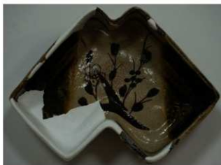
② 織部焼向付(江戸時代)