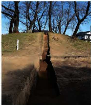
3トレンチ全景(南から)