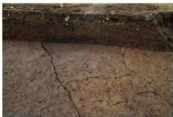
途切れる外側外堀プラン (西から)