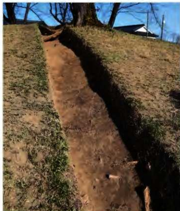
中央の黒褐色土が中段テラスの埋土か(推定)