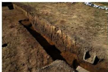
内堀断面 (北東から)