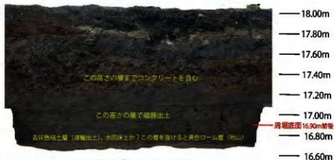
東壁サブトレンチ断面