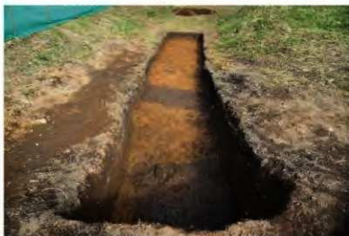
1 トレンチ北検出全景（南から）