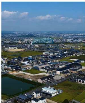
現在の六坪周辺航空写真 (南東から)