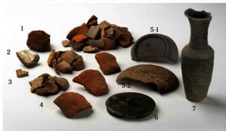
平城京左京八条三坊六坪で出土した遺物

これらのことを総合的に判断すると、この六坪に関しては「東市」の存在が臆げながらも想定できる段階であるといえるのではないのでしょうか。