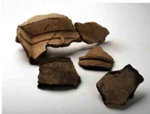
佐紀池ノ尻古墳出土埴輪 集合写真

このように、佐紀池ノ尻古墳は佐紀古墳群東群で最初に築造された大型前方後円墳である可能性があります。そのため、西群から東群へは画期的に大型古墳の築造が移行したのではなく、移行期に大型古墳が並存しながら移っていったとみられます。このことは佐紀古墳群の造営集団を考えるうえで非常に重要であり、佐紀池ノ尻古墳がもたらす意義は今後の佐紀古墳群研究に大きな影響を与えるものと評価できます。