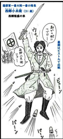
薩摩軍一番大隊一番小隊長 西郷小兵衛(31歳) 西郷隆盛の弟