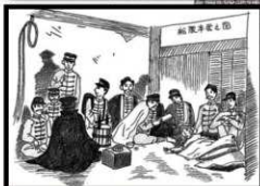
「船隈本営の図」(従征日記より)