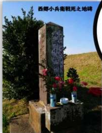
西郷小兵衛戦死之地碑