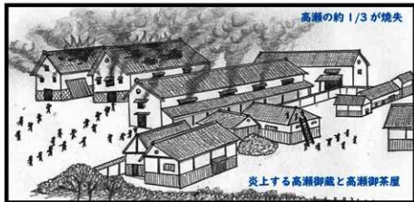
炎上する高瀬御蔵と高瀬御茶屋

▲政府軍は高瀬の町に放火。この時、高瀬御蔵などの重要施設も焼失。民家など約200戸も焼失してしまいました。