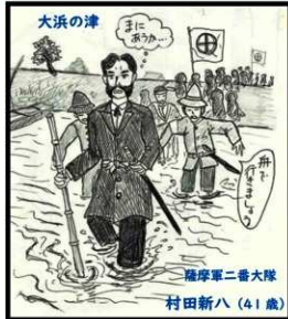
薩摩軍二番大隊 村田新八(41歳)