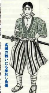
高瀬の戦いにも参加し負傷