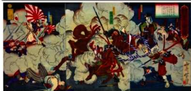
絵巻『西郷小平討死図』市博物館図録より