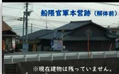
※現在建物は残っていません。