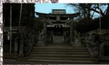
政府軍本営となった繁根木八幡宮

なぜ、この高瀬が戦場となったのでしょうか。政府軍は熊本城救出のため、南関から高瀬(三池往還)を通りました。しかし、乃木隊が樋木から高瀬まで退却し、主力部隊の到着まで食料も確保できるこの高瀬で待ったことが大きく要因しました。そして、菊池川を挟み、起伏が少ない高瀬と玉名平野が激戦地となったのでした。