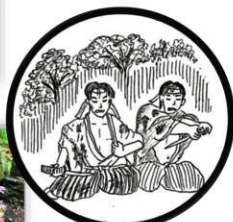
▲加治木隊の墓(玉名市梅林)

▲政府軍は南関へ進行中の加治木隊を見つけ、攻撃します。この時に負傷して取り残された隊員19名は、白虎隊のような集団自決をするという悲劇が起こりました。その後、遺骨は遺族によって国元へ持ち帰られています。