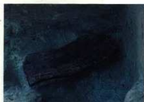
井戸跡から出土した木製短甲