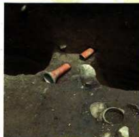
筒形器台出土の様子