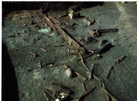
流路からたくさん出土した木製品