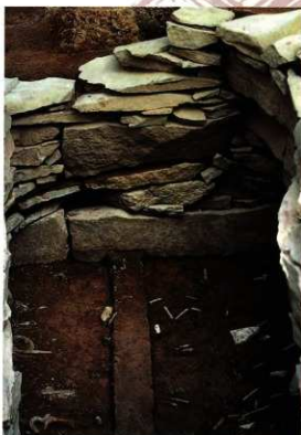
石室内の遺物出土の様子