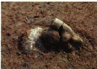
頭や手足が欠かれた土偶