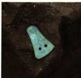
石戈の転用品が出土