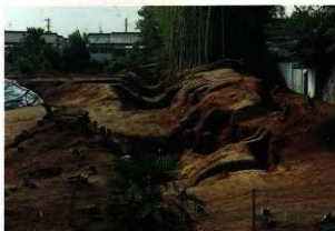
堀および土塁のあと