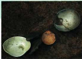
出土遺物（青磁碗・土師皿・瓦器類）

これまで数回発掘調査が行なわれてきましたが、平成11年度から12年度にかけての調査で、溝状遺構や土坑墓などが見つかり、寺に関連するものの可能性があります。