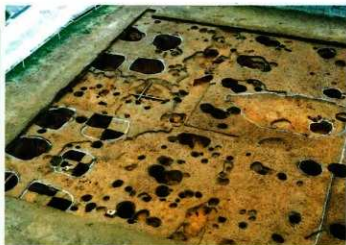
規則的に並んだ柱穴

正野神社北側の台地上にあり、一部が玉名市の指定史跡になっています。昭和31年の発掘調査で、柱の土台である礎石群が見つかり、炭化した米が出土することなどから、郡倉跡と推定されています。平成4年の調査では、礎石を使った建物より前の時期の掘立柱建物が確認されています。平成12・14年には、平成4年に調査を行なった地点の隣接地を調査し、規則的に並んだ建物跡を確認しています。見つかった柱穴は、直径が1mから1.5mもある立派なもので、柱穴の配置からいずれも米倉と考えられます。