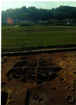
弥生時代の竪穴住居の跡(東から)