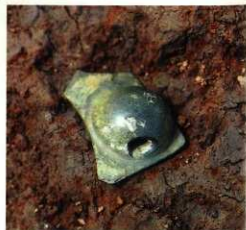
割られた青銅鏡の一部(鈕部)