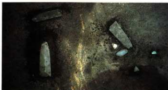
甕棺内出土「磨製石剣」