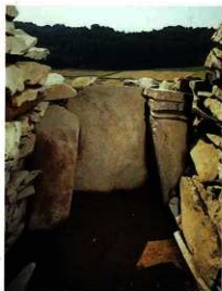
石室内から見た「閉塞石」