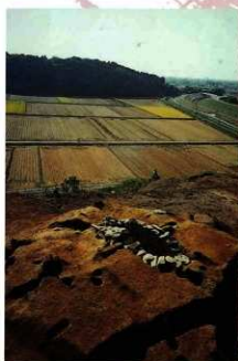
墳丘と石室の様子