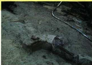
縄文時代の弓(左上)

菊池川左岸の水田地帯にあります。縄文時代後晩期から中世にかけての生活のあとが発見されました。水田の真下2mのところにあった縄文時代の自然流路からは県内最古の弓、溝のある磁石、頭や手足が欠かれた土偶、ドングリを煮て焼き付いた土器などが出土しています。玉名平野において縄文時代の人びとの生活した様子が復元できる点が注目されます。