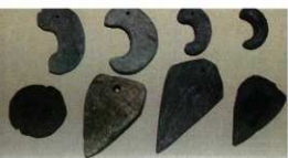
展示してある石製品 (赤矢印のケース内)

まほろんの常設展示室では各時代の食卓が再現されており、時代ごとの特徴的な遺物も展示しています。