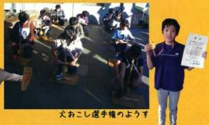
火おこし選手権の様子

大好評のバックヤードツアーをはじめ、那須高原ビジターセンター、国立那須甲子青少年自然の家、体験ブースや、アクアマリンふくしまの移動水族館も出展され、大盛り上がりの3日間でした。