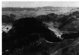
（左）明治後期～大正初期、右：平成14年