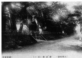
（左）明治後期 （右）平成14年