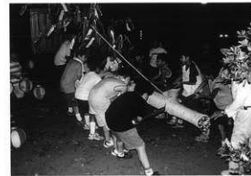
竹神輿でのお祝い