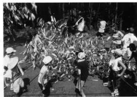
竹飾りでのお祝い