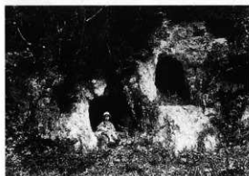
（左）明治後期～大正初期、右：平成14年