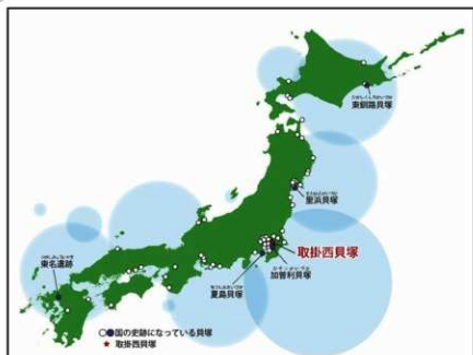
国史跡に指定された貝塚

将来の史跡整備計画の策定に際し、商業・観光と連携した史跡活用の視点も取り入れるよう検討する。